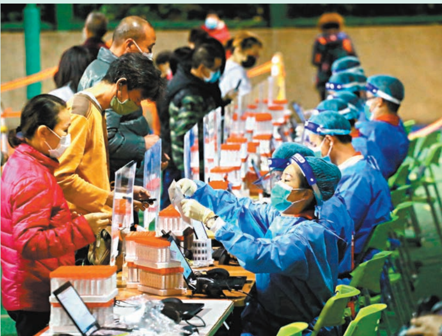
◆葵涌邨逸葵樓出現1宗確診和1宗初確，逸葵樓居民昨晚接受檢測。