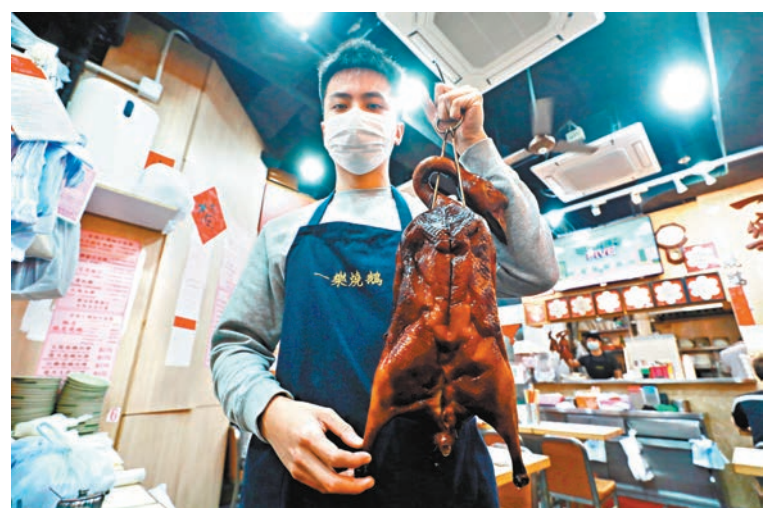
▲2022米芝蓮食店，位於中環士丹利街34-38號地舖的「一樂燒鵝」連續8年獲一星評價。