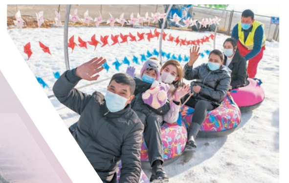
◆遊客在舞伊納克滑雪場滑雪圈。