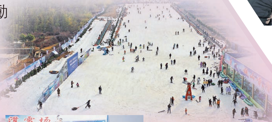
◆江蘇盱眙鐵山寺滑雪場

早前，江蘇盱眙鐵山寺滑雪場舉行今冬開滑儀式，吸引不少市民和遊客體驗雪上運動的樂趣，當中更有家長帶着孩子在滑雪場體驗滑雪。鐵山寺國家森林公園是國家4A級旅遊景區，佔地70.58平方公里，其中23.73平方公里的次生林海和群山環抱着的9平方公里的純淨的天泉湖，構成了獨特的小氣候環境。而鐵山寺滑雪場則擁有多條滑雪道、滑雪圈道、多彩嬉雪區、生態停車場，並擁有大型進口造雪機10餘台、滑雪板2000餘副、滑雪圈500個、多台雪地摩托及魔毯兩條，供遊客使用。