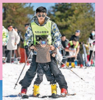
◆小朋友在教練的帶領下學習滑雪。

位於江西宜春市西南的明月山上，有個宜春明月山滑雪場，遊客在此體驗滑雪運動。滑雪場在明月山景區纜車站上，雪場佔地面積約為10000平方米，滑雪場內擁有各項滑雪所需設備，並配有專業滑雪教練，場內設有滑雪區、戲雪區和教練區，滑雪區設有初級滑道1條及滑圈區滑道4條，戲雪區內則提供多種趣味活動項目，場內還配有「魔毯」負責運送滑雪人員上行，方便遊客輕鬆滑雪。