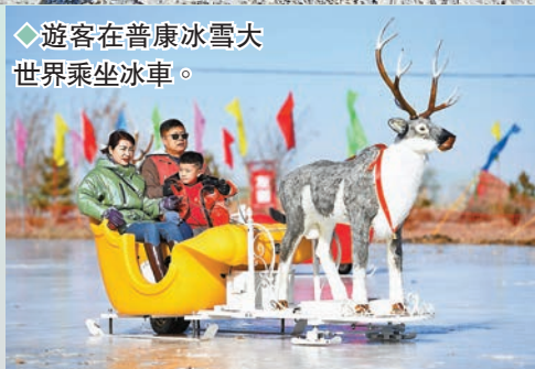
◆遊客在普康冰雪大世界乘坐冰車。