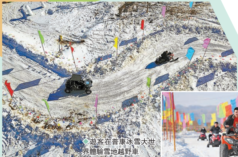
◆遊客在普康冰雪大世界體驗雪地越野車。

邂逅雪景。滑雪區開放初級雪道3條、中級雪道1條及魔毯4條，並有5000餘套進口的滑雪裝備，包含了單板、雙板、滑雪服、雪杖、雪鏡、雪鞋、頭盔、護甲等基礎裝備。