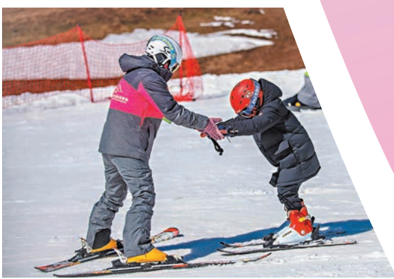
◆滑雪場內，小朋友在教練指導下學習滑雪。

會澤大海草山是國家級4A級景區，擁有18萬畝高山草甸，是雲南面積最大的高山草甸之一，地形地貌獨特，冬季雲海、雪海、霧凇景色優美，連綿起伏的高山草甸被白雪深深淺淺地覆蓋着，還有成群的雪地綿羊，大家在這裏可以