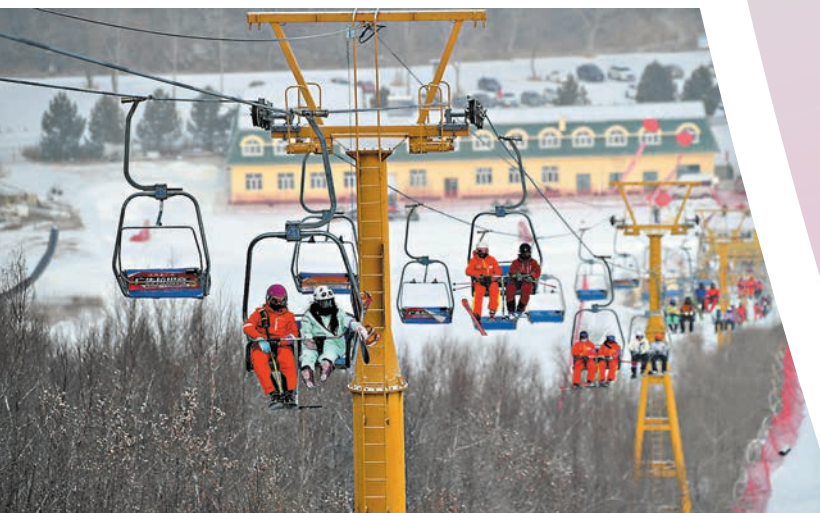
◆滑雪愛好者在金龍山滑雪場乘坐纜車。

雪道、滑冰場、雪上樂園、兒童樂園、雪洞等娛樂場地可以為遊客提供雙板滑雪、單板滑雪、雪上飛碟、雪地足球、雪地自行車、雪地摩托、狗拉爬犁、速滑、冰球、兒童娛樂等多種活動項目。而且，其2000平米遊客服務大廳、從德國和瑞典進口的壓雪車和造雪機、從日本進口的滑雪板等雪場專用的設施設備，為滑雪者提供方便、快捷、舒適的服務，滑雪愛好者在這兒滑雪，享受冰雪運動帶來的快樂。