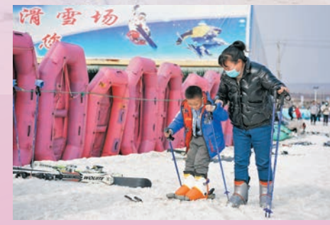
◆家長帶着孩子在盱眙鐵山寺滑雪場體驗滑雪。