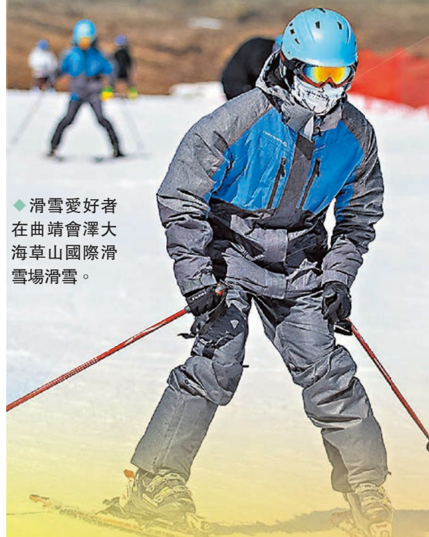
◆滑雪愛好者在曲靖會澤大海草山國際滑雪場滑雪。