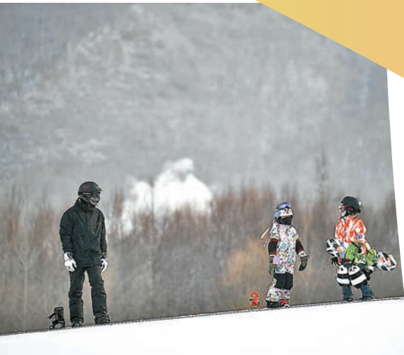
◆滑雪愛好者在金龍山滑雪場乘坐「魔毯」。