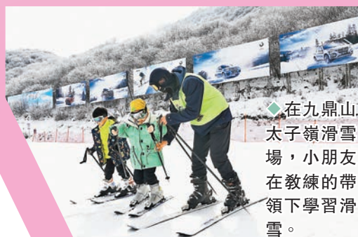
◆在九鼎山太子嶺滑雪場，小朋友在教練的帶領下學習滑雪。

位於四川茂縣九鼎山風景區的九鼎山太子嶺滑雪場，距成都市約160公里，從成都驅車前往需2.5小時，路況良好，是川渝兩地民眾休閒娛樂的新去處。截至2013年，建成1條高級道、1條中級道、3條初級道，合計2.5公里雪道，可以同時容納2000人滑雪和用餐，其中中級道（青龍道）長1.7公里，雪道寬闊，適合小朋友在教練的帶領下學習滑雪。