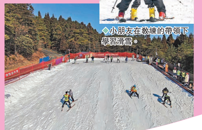
◆江西宜春明月山滑雪場