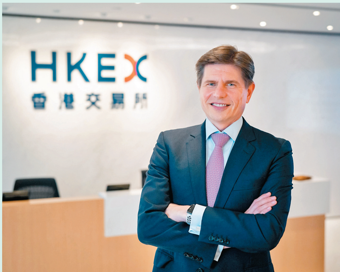
◆歐冠昇預料未來10年內地市場的規模將超過100萬億美元，有望成為全球最大的經濟體，形容內地「金融大發展」時代已經來到。