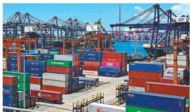
◆香港出口貨值在疫情期間持續錄得升幅。

藥明生物(2269)先升後挫2.63%，收86.85元，藥明康德(2359)發盈喜，全日先升後急挫7.348%收市，最終報122.3元。