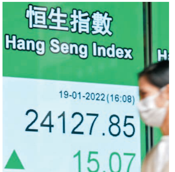
◆恒生指數昨日收市報24,127.85點，上升15.07點，微升0.1%。

面對內地「金融大發展」機遇的到來，歐冠昇昨日在網誌中指出，香港可在促進經濟發展、提升互聯互通、推動跨境資本加速流動，以及創新方面發揮巨大作用，從而推動這一巨變的發生，這一巨變將遠速地重塑全球市場格局，為所有人創造機會。他表示，隨着內地經濟的高速增長，未來10至15年有望躍升成為全球最大經濟體，金融領域的重大改革，是這一巨變的主要推動力。未來將越來越多家庭，會開始把部分儲蓄，投入到資本市場的金融產品上，總規模可能高達50萬億美元。