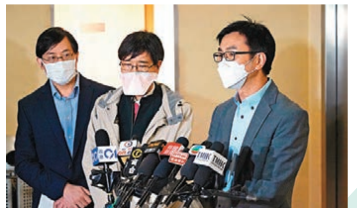
昨晚袁國勇等專家團隊進入逸葵樓調查至凌晨零時才結束。袁國勇指出，大家要預備好疫情愈嚴重時，可以做到有效的家居隔離。

入夜後，衛生署陸續接獲更多來自該大廈的染疫個案，涉及的樓層包括1樓、3樓、4樓、5樓、7樓、8樓、11樓、14樓、22樓、26樓及32樓共8個座向。袁國勇昨晚聯同衛生署衛生防護中心傳染病處首席醫生歐家榮、環保署及房屋署官員到場視察後，發現大廈喉管結構良好，無結構性播疫風險，但基因分析顯示兩名染疫居民帶有Omicron BA.2亞型病毒，與早前在檢疫酒店染病的巴裔婦屬同一類病毒。經流行病學調查發現，原來巴裔婦的丈夫受感染後，曾到逸葵樓的垃圾房執垃圾。袁國勇說：「那兒的垃圾房無上鎖，有工人在此休息、傾偈、進食，有可能在垃圾房將病毒傳給大廈清潔工人及保安人員。」