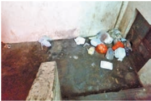
◆深水埗區一些「三無大廈」因有清潔工人離職而無人清理垃圾，大廈樓梯堆積垃圾，環境非常惡劣。