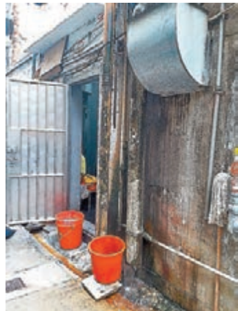
◆深水埗區內舊樓後巷，亦發現污水遍地，且因渠管滲漏而出現污水從天飛濺的情況，令途人觸目驚心。