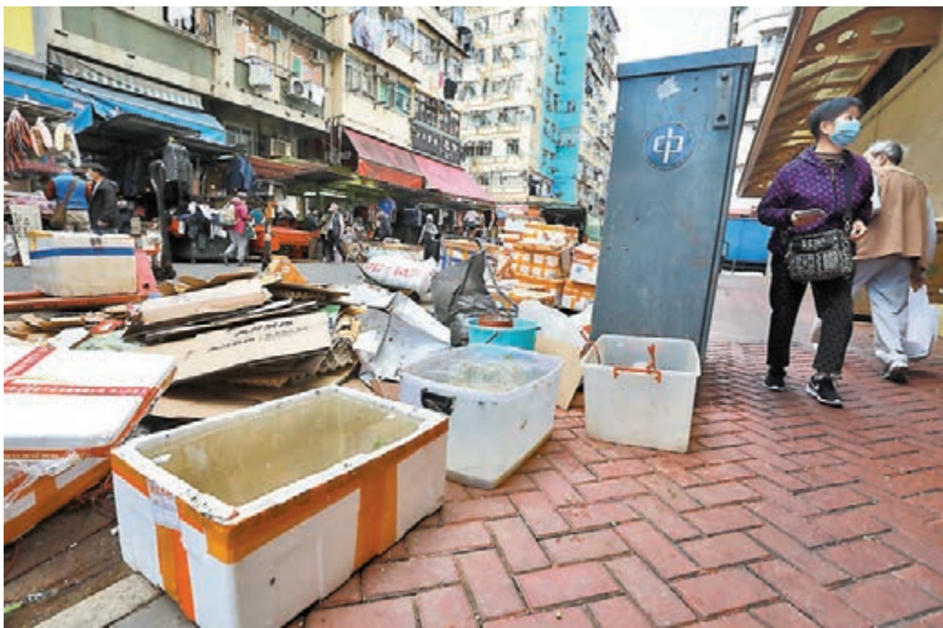
◆深水埗北河街街市一帶路邊不時堆滿垃圾，甚至有發泡膠箱盛載滿瀉的污水，衛生環境惡劣，潛在播疫危機。

同時，由於區內人煙稠密，部分街市檔口、排檔地攤的行人通道聚集人群，肩摩股擊，更應做好防疫措施。然而，除了有人站在一旁脫下口罩吸煙外，更大問題是不少於攤檔購物者的口罩並無覆蓋鼻子，甚至有不少人並無佩戴口罩，一旦當中存在隱形傳播者，隨時牽連多人染疫且難以追蹤。