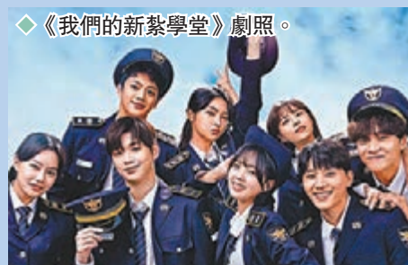
◆《我們的新學堂》劇照。

除此之外，改編自人氣同名漫畫於webtoon連載的電視劇《殭屍校園》乃韓國驚悚劇集，由《海盜2》的編劇千成日合作打造，將於1月28日開播。《無人知曉》尹燦榮、《小婦人》朴持厚、《機智醫生生活》趙怡賢、《復仇筆記》朴所羅門、《遠看是蔚藍的春天》劉仁秀、孫相淵等