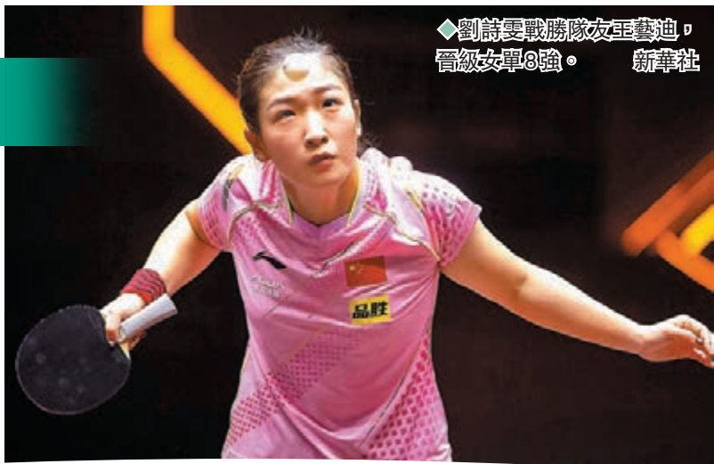
◆劉詩雯戰勝隊友王藝迪，晉級女單8強。 新華社

被問到近況時，她表示：「未來肯定會面臨逐漸的轉型，但乒乓球是我熱愛的事業，我希望推廣乒乓球，讓更多人喜愛這項運動。」劉詩雯希望2022年給大家留下更多精彩的比賽。