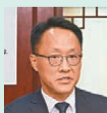
韓國駐港總領事白龍天

香港文匯報訊 意大利駐香港總領事館領事孔德樂 (Clemente Contestabile)、韓國駐香港總領事白龍天 (Baek Yong-chun) 近日接受點新聞和大公文匯全媒體專訪時，表達了對北京冬奧的期待和支持。孔德樂表示，儘管在逆境下，北京冬奧會一定會取得成功。