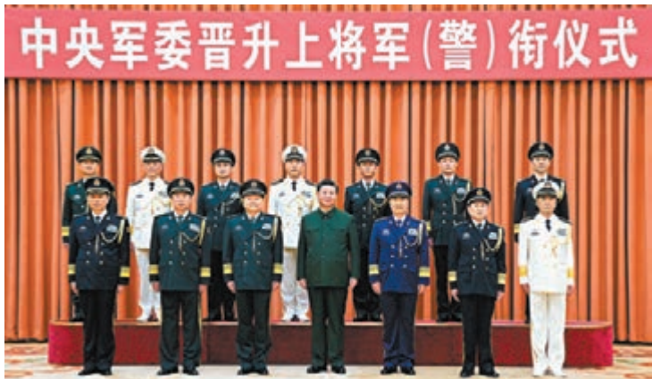
◆中央軍委晉升上將軍銜警銜儀式21日在北京八一大樓隆重舉行。習近平向晉升上將軍銜警銜的軍官警官頒發命令狀，並合影。

香港文匯報訊 據新華社報道，中央軍委晉升上將軍銜警銜儀式21日在北京八一大樓隆重舉行。中央軍委主席習近平向晉升上將軍銜警銜的軍官警官頒發命令狀。