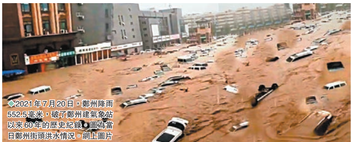
◆2021年7月20日，鄭州降雨552.5毫米，破了鄭州氣象站以來60年的歷史紀錄。圖為當日鄭州街頭洪水情況。網上圖片

針對災害應對處置中暴露的問題，調查組總結了六個方面的主要教訓：鄭州市一些領導幹部特別是主要負責人缺乏風險意識和底線思維；市委市政府及有關區縣(市)黨委政府未能有效發揮統一領導作用；貫徹中央關於應急管理體制改革部署不堅決不到位；發展理念存在偏差，城市建設「重面子、輕裏子」；應急管理體系和能力薄弱，預警與響應聯動機制不健全等問題突出；幹部群眾應急能力和防災避險自救知識嚴重不足。