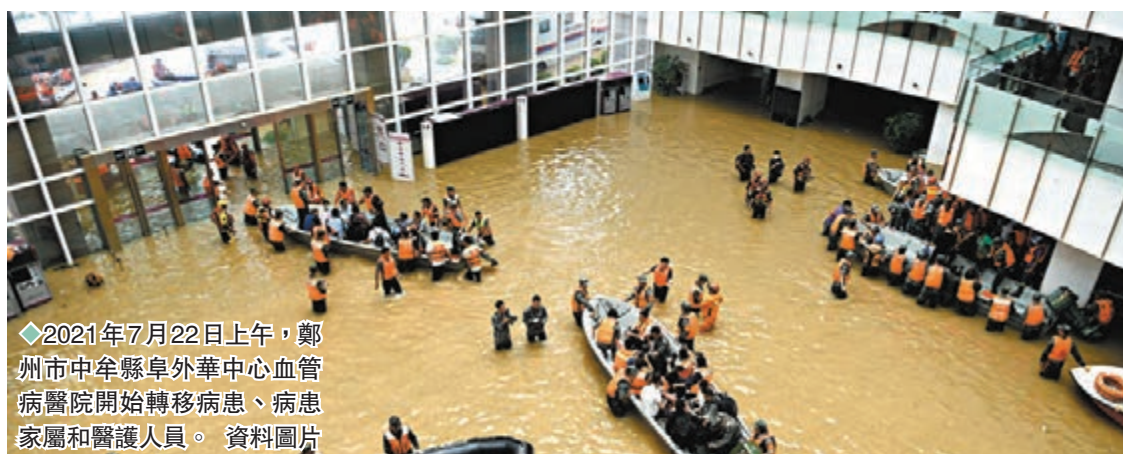
◆2021年7月22日上午，鄭州市中牟縣阜外華中心血管病醫院開始轉移病患、病患家屬和醫護人員。資料圖片