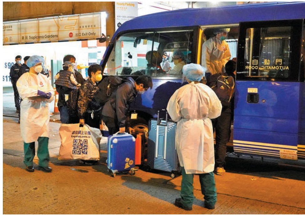
◆黃大仙豪苑第一座出現垂直傳播，E室單位住戶昨夜攜帶簡單行李，扶老攜幼地登上專車，撤離該大廈。