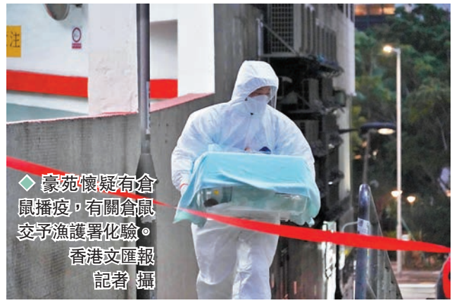
◆豪苑懷疑有倉鼠播疫，有關倉鼠已交予漁護署化驗。

因應黃大仙區有污水樣本檢測呈陽性，政府早前將豪苑及鳳德公園等納入強制檢測範圍，結果發現豪苑有兩宗確診及一宗初確，3人均居於第一座E單位，因此懷疑大廈出現垂直傳播。