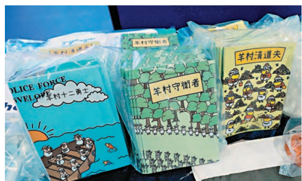
◆警方國安處早前在行動中檢獲涉嫌煽仇搗暴的《羊村》兒童繪本。

香港文匯報訊(記者 葛婷)現已被撤銷登記的「香港言語治療師總會」5名前骨幹，去年7月被警方國安處拘捕指他們涉嫌發布一系列煽仇搗暴的兒童繪本，被控「串謀刊印、發布、分發、展示或複製煽動刊物」罪。案件昨在區域法院再提訊，控方申請案件由國安法指定法官負責，指出終院已表明本案控罪涉及危害國家安全罪行，辯方則提出反對。法官郭偉健在聽取控辯陳詞後，裁定本案由國安法指定法官處理，並根據檔期安排自己為審訊法官，案件押後至7月5日開審，其間各被告須繼續還押。