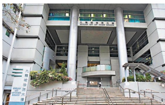
◆九龍城裁判法院。

香港文匯報訊(記者 葛婷)民政事務總署一名署理高級行政女主任於2018年至2020年期間三度欺騙該署，提交「申請離開工作崗位」申請表，詎稱去看中醫，但實際卻去參加跳舞班的舞蹈班。