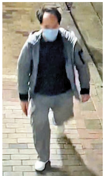
▶閉路電視拍下疑犯身影，令警方得以迅速鎖定疑犯身份。

隊等，通緝在區內布防及加強巡邏，又翻查大量閉路電視片段，終鎖定疑犯身份，並相信其居住在大南街其中一樓宇。