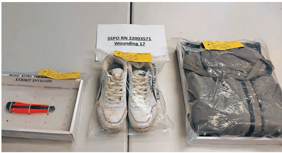
▲警方在拘捕行動中檢獲疑犯用作傷人的鐮刀和穿着的衣物和鞋子。

為盡快解除危機，緝捕鐮刀狂徒歸案，深水埗警區重案組人員，隨後聯同西九龍總區刑事部、機動部隊及深水埗分區特遣