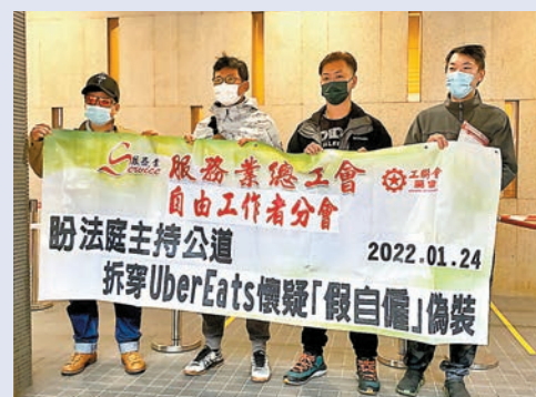
◆工聯會將幫助苦主向Uber Eats索償。

工會認為，有關外賣員在合約上雖然屬自僱人士，但工作採取「包鐘」制，他們入職時便有一個固定的工作時間及工作地區，每周工作不少於6天，如需請假，需要提早向平台申請，並得到批准才可以請假，病假則最少需要提早一小時申請並提供醫生證明，