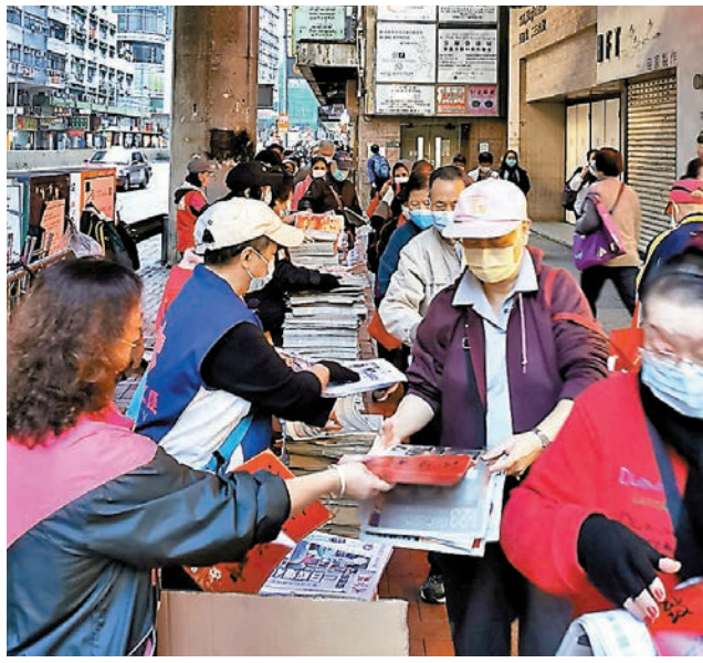
◆市民排隊領取《大公報》及揮春。