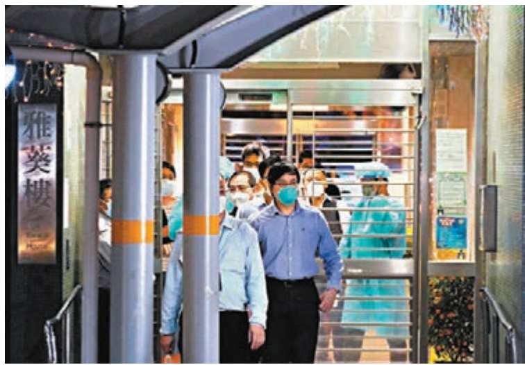
◆防疫專家團隊昨晚赴葵涌邨雅葵樓調研，該廈所有09單位坐向居民須撤離。