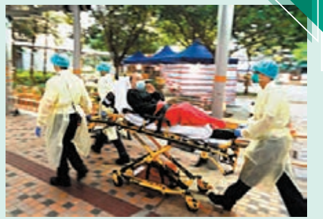
◆葵涌邨有市民昨日下午不適送院。