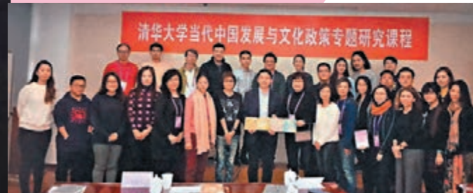
◆2018年推廣協會組織了30多位香港年輕人赴北京清華大學遊學，使一班優秀菁英了解中國歷史，認識中華。