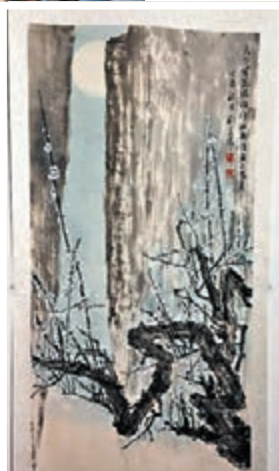
▶陳樂怡的書法作品《謝混·遊西池》。