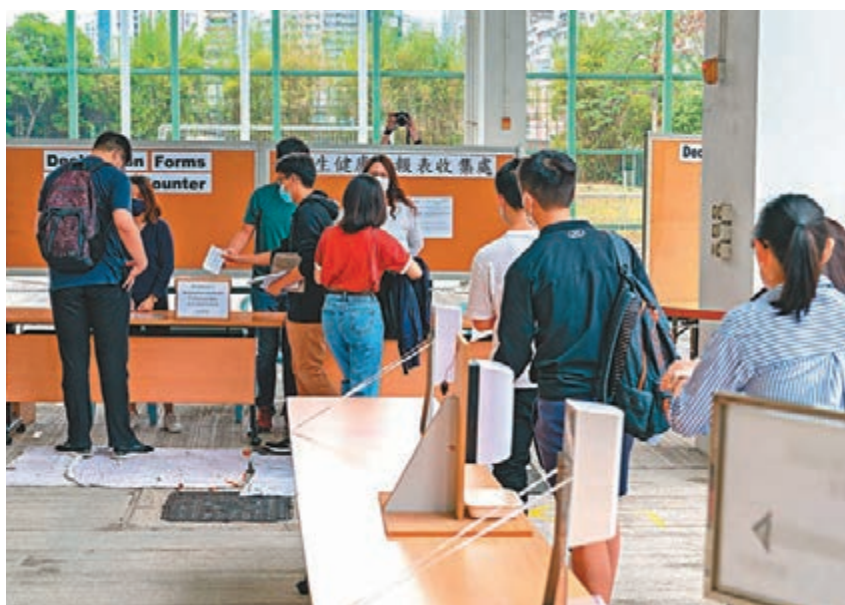
◆今年考生進入考場前亦需要遞交健康申報表。圖為去年考生進入考場前遞交健康申報表。資料圖片