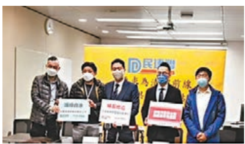
◆ 民建聯昨日促請特區政府，為前線清潔工人及保安員提供每月1,000元津貼，為期7個月。

香港文匯報訊(記者張弦)第五波新冠肺炎疫情嚴峻，前線清潔工人及保安員的工作量大增，更承擔較高的感染風險，民建聯昨日促請特區政府，為前線清潔工人及保安員提供每月1,000元津貼，為期7個月。特區行政長官林鄭月娥其後在社交平台fb表態支持，表示籌備中的「防疫抗疫基金6.0」，為全港20多萬名清潔工人和保安員提供額外的防疫津貼是合情合理的。