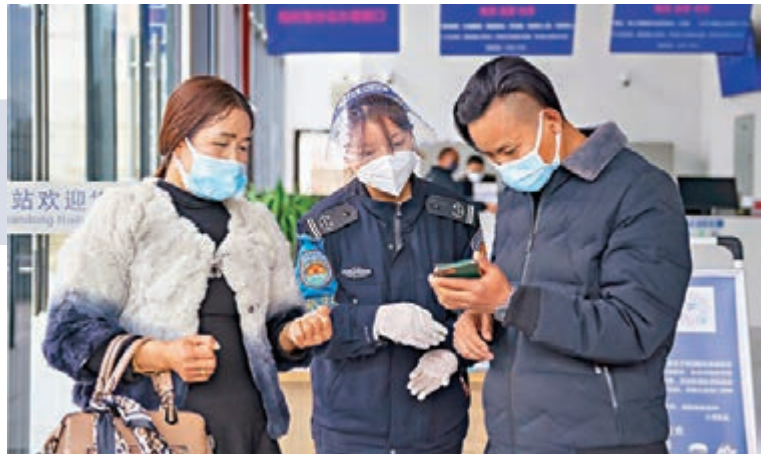
◆春節臨近，在雲南小灣車站，旅客向工作人員出示健康碼。

截至28日，內地累計報告接種新冠疫苗29億9,416.2萬劑次，接種疫苗的總人數達到12億6,607萬人，已完成全程接種12億2,738.7萬人，其中60歲以上的老年人完成全程接種的有2億1,022.9萬人。此外，截至24日，內地共有12,000餘家醫療衛生機構可開展新冠病毒核酸檢測，總檢測能力達每天4,200萬份。