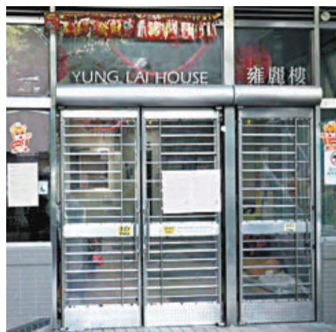
◆油塘油麗邨雅麗樓。