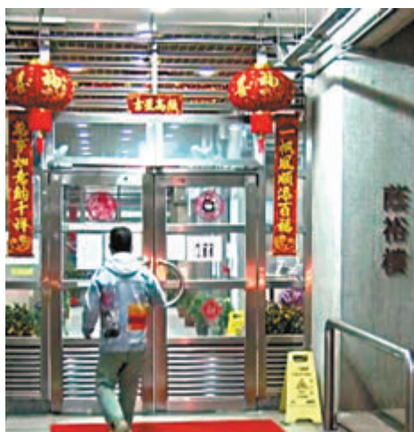
◆葵涌石蔴東邨蔴裕樓。