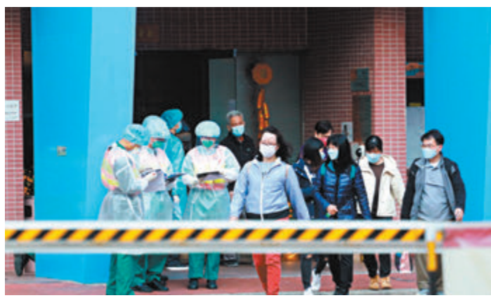
◆再多3棟大廈出現垂直傳播。圖為青衣宏福花園部分居民撤離。

香港感染及傳染病學學會副會長林錫遜表示，垂直傳播在過往幾波疫情中都有出現，但這波疫情似乎特別多，涉及諸多因素。「Omicron、Delta傳播力強都是一個因素，另外適宜的天氣、濕