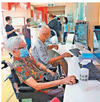
特区政府昨日宣布展開新一輪院舍員工強檢。圖為居於安老院舍的長者。

社署發言人指出，由第二十六輪強制檢測起，若非獲醫生書面證明因健康理由沒有接種疫苗的院舍員工，需自費接受強制檢測，而政府會繼續視乎疫情發展，及因應各項防疫措施調整有關檢測政策，已完成接種的人員雖獲豁免定期強檢，但若自願仍可獲免費提供病毒檢測。