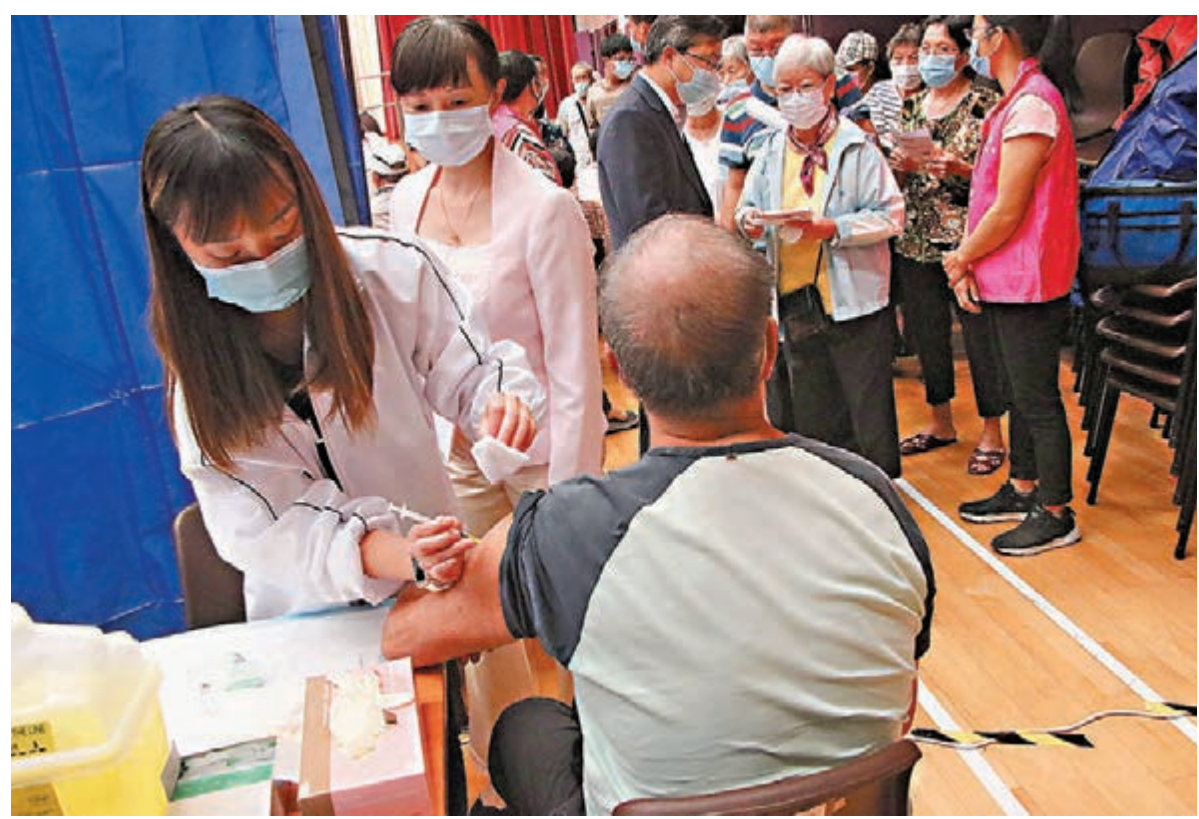
未接種疫苗患者病毒量比已打針的患者高。圖為長者接種疫苗。

孔繁毅亦支持兒童接種，因為疫苗同樣可減低兒童染疫後的重症及死亡率，並可在家庭內達至群體免疫，避免傳播至家庭內的年邁成員。有家長擔心疫苗