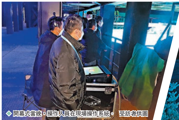
開幕式當晚，操作人員在現場操作系統。

香港文匯報訊（記者 王莉、郭若溪、李望賢 杭州、深圳報道）2月4日晚，在北京第二十四屆冬季奧林匹克運動會開幕式上，兩位火炬手徒步跑向北京國家體育場內雪花形的主火炬台，把最後一棒火炬直接放在主火炬台上，隨後這片「大雪花」旋轉升起，高高地懸掛在體育館上空，實現了奧運歷史上又一次點火方式的創新。