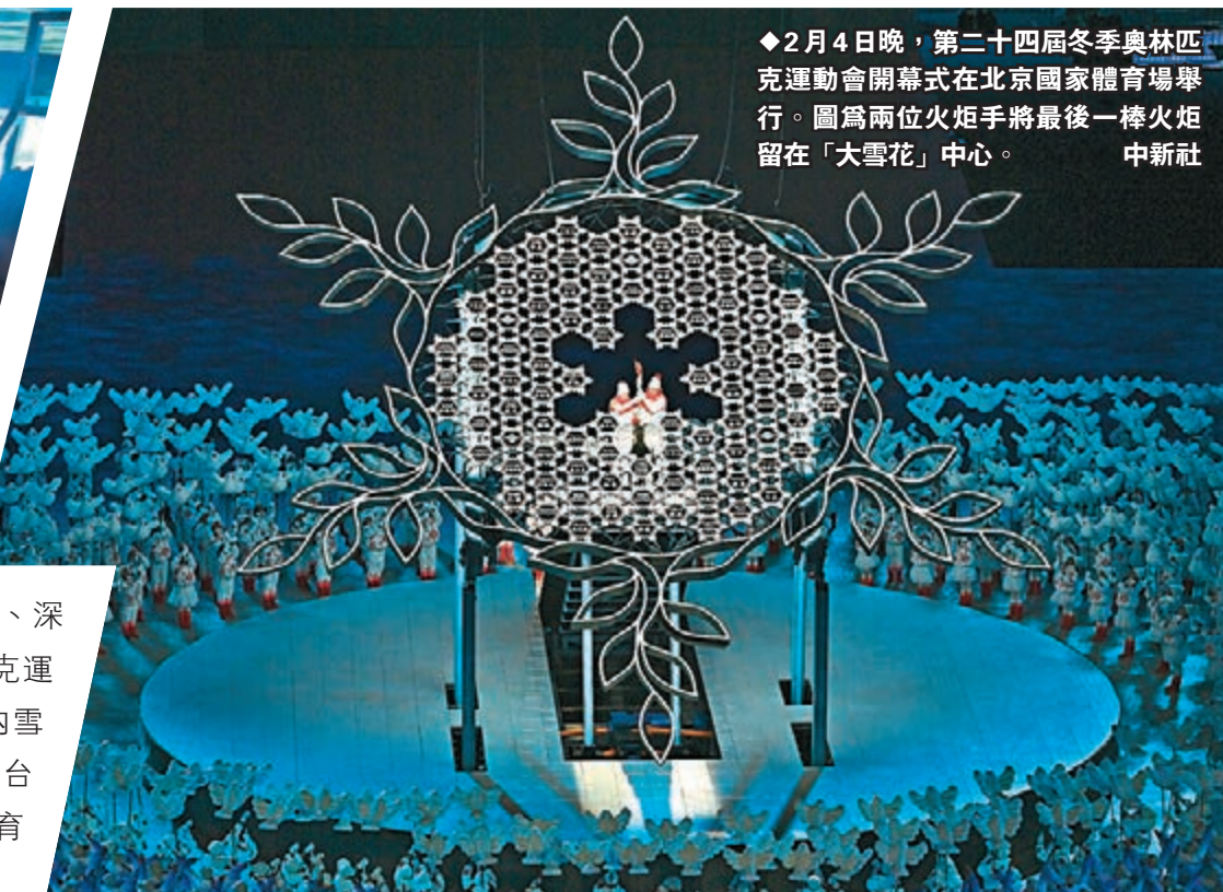
2月4日晚，第二十四屆冬季奧林匹克運動會開幕式在北京國家體育場舉行。圖為兩位火炬手將最後一棒火炬留在「大雪花」中心。

據悉，相較傳統的地面平整度測量方法，深大團隊研發的平整度測量機械人具有精度高、測點密、效率快、可定位、靈活性好等優點。機械人的相對高程測量精度優於0.5mm/5m，測量綜合效率相較於傳統水準儀法提升5-10倍，完全滿足超大室內混凝土基底的平整度測量與評估需求。團隊於2020年10月-12月建設期間對國家速滑館實施了兩次全面測量，總測線距離超過20km。