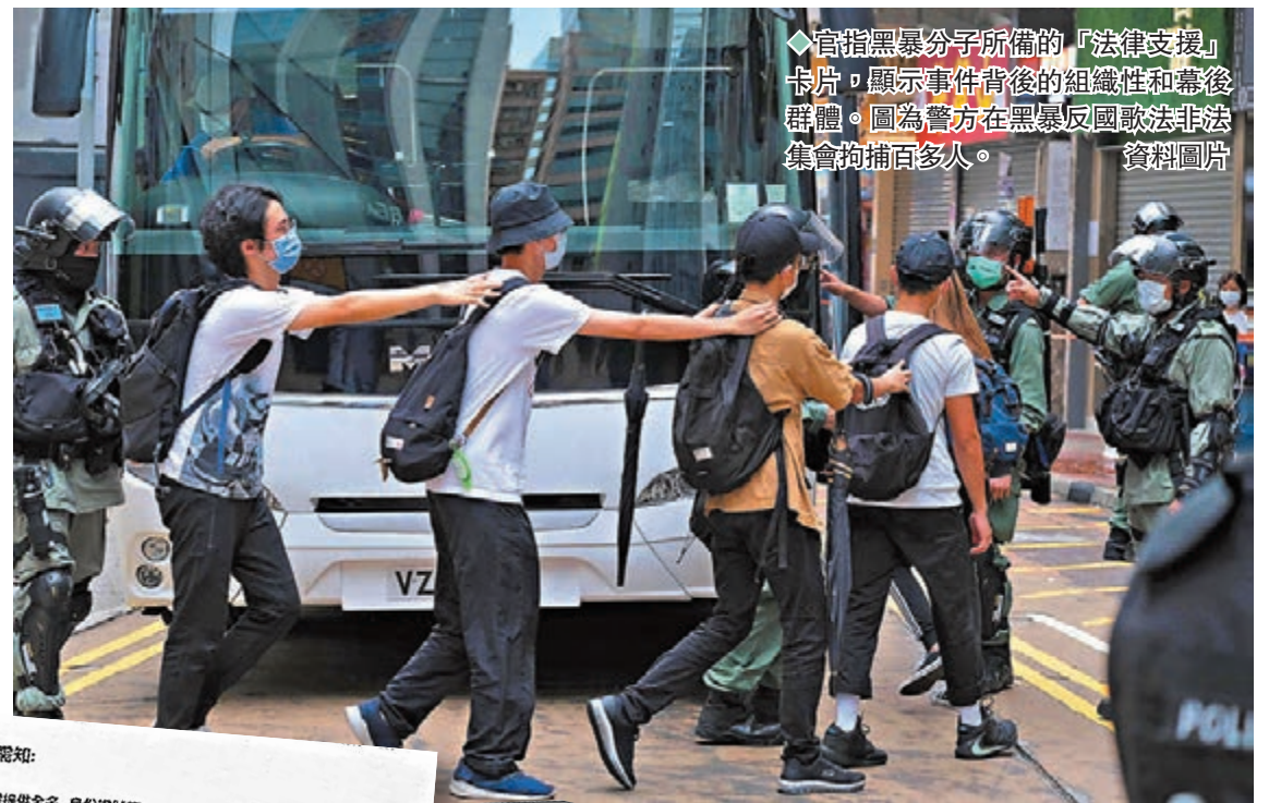
◆高指黑暴分子所備的「法律支援」卡片，顯示事件背後的組織性和幕後群體。圖為警方在黑暴反國歌法非法集會拘捕百多人。資料圖片

陳官指，這些卡片所列出的機構或電話號碼可能是虛構，可能是捏造，他亦不會猜測為何有人有這些耐性和資源去印製這些卡片，好讓被捕者行使他們的權利，對警員的盤問不作出回應，不簽任何文件。他不會評論這些人士或機構或公司是否屬於特區終審法院所提及的鼓勵者，或是從犯或是涉及尚未開始的刑責（accessorial or inchoate liability），亦不評論有沒有人違反專業守則。