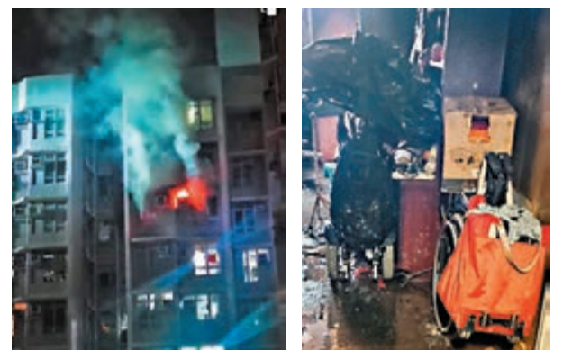
◆廣明苑一單位昨晨起火及冒出濃煙。視頻截圖

由於不少居民已入睡，對面大廈有熱心居民不斷大呼「火燭呀，起身呀」。大廈有約220名居民走火警緊急疏散，當中不少也是從睡夢中驚醒的居民，匆忙間僅穿着睡衣冒寒落樓逃生，非常狼狽。消防煙帽隊進入大廈