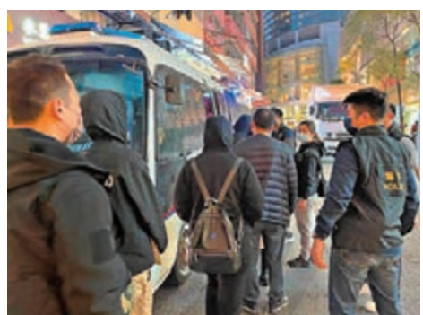
◆警方在荃灣新村街非法網上百家樂賭檔帶走賭客。

另外，深水埗警區及觀塘警區前晚分別展開反罪惡行動，搜查區內多間表列處所，在長沙灣永康街23至27號一工業大廈發現一間懷疑違規經營的派對房間。行動中，拘捕一名姓黃（39歲）男負責人涉嫌違反「禁業令」現正被扣留調查。而場內7男4女（29歲至36歲）則涉嫌違反「限聚令」被警員發出定額罰款通知書。至於，觀塘警區雜項調查隊人員則發現在開源道45號一派對房間懷疑正在違規營業。5名女子（18歲至21歲）涉嫌違反「禁業令」，被發出定額罰款通知書。