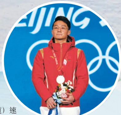
▶任子威登上短道速滑1000米最高領獎台。