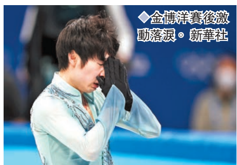
◆金博洋賽後激動落淚。

香港文匯報訊（記者 楊浩然）中國名將金博洋同樣於昨日的花樣滑冰男子單人滑短節目登場，最終獲得90.98分以第11名晉級10日（周四）比賽，這位24歲選