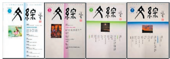
「世界華文文學聯會」旗下刊物《文綜》文學季刊。