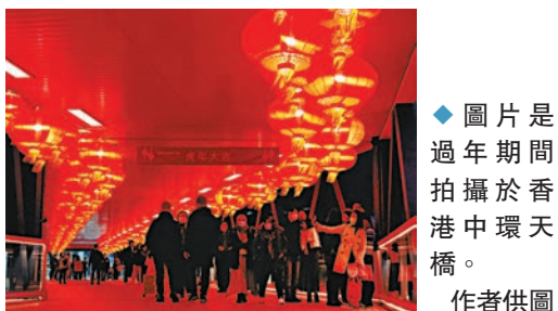
圖片是過年期間拍攝於香港中環天橋。