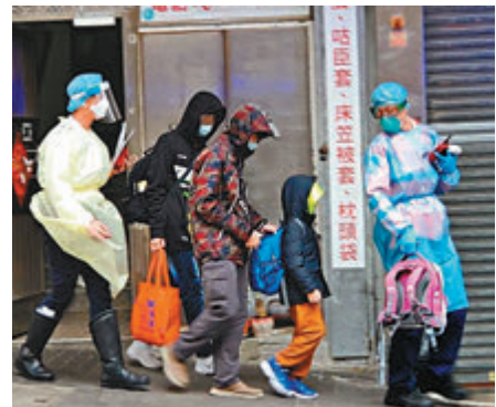
◆救護人員指示病人登上救護車送院。

香港文匯報訊（記者 蕭景源）本港新冠肺炎確診個案屢見新高，各區市民人心惶惶。觀塘康寧大廈兩個住宅單位，昨晨一家共10人均出現發燒症狀，懷疑集體感染新冠肺炎，慌忙報警求助，到場救護人員亦慎重起見，全程穿著保護裝備，將10人分送4間醫院檢驗。