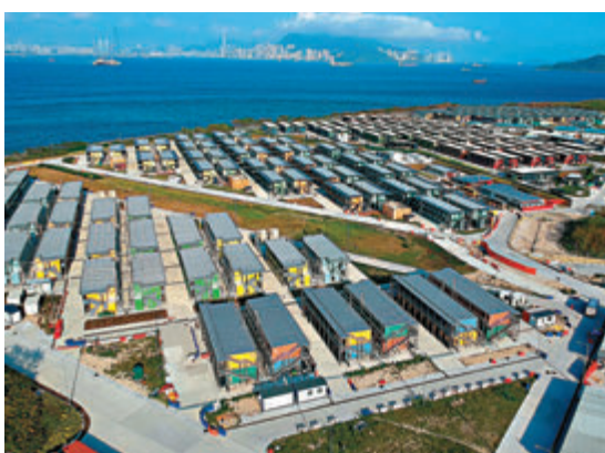
◆特區政府加快安排於竹篙灣一期隔離檢疫的密切接触者返家隔離，截至昨日凌晨已有606名密切接触者居家隔離。圖為竹篙灣檢疫中心。

醫管局總行政經理（綜合臨床服務）李立業醫生昨日在疫情記者會上表示，「居家防疫」計劃下，原本在竹篙灣的密切接触者被安排返家隔離，昨日一共騰空竹篙灣一期500張至600張隔離床，目前已安排約200名輕症病人入住。亞博館社區治療設施將來會安排合資格輕症病人入住，但他預計新騰空的隔離病床將很快飽和，正加緊安排竹篙灣二期的密切接触者返家隔離，以騰出更多隔離病床。同時積極尋找更多的社區隔離設施，及降低確診病人出院標準，讓無症狀病人出院居家隔離。