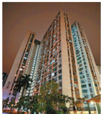
◆元朗朗屏邨鵝屏樓及鳳屏樓昨晚被圍封強檢。圖為鳳屏樓。

香港文匯報訊（記者 文森）自周日（6日）晚上被「封樓」的屯門良景邨良傑樓，圍封強檢行動再次被延長至今日。特區政府表示，良傑樓至今累計發現70宗初步確診個案，由於爆發單位分散，懷疑大廈有傳播鏈，故一再延長圍封行動。不過，有居民認為，逐日「加監」使他們的生活失去預算。