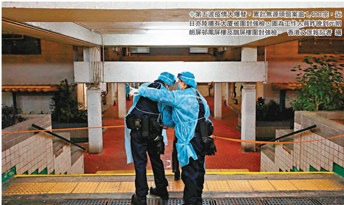
◆第五波疫情大爆發，累計無源頭個案逾1,400宗，近日亦陸續有大廈被圍封強檢，圖為工作人員昨晚到元朗朗屏邨鳳屏樓及鵝屏樓圍封強檢。

衛生防護中心傳染病處主任張竹君昨日在疫情記者會上指出，第五波疫情至今，香港累計的無源頭個案逾1,400宗，大部分新增無源頭個案並非全部沒有線索，只是無法找到直接傳播源頭。