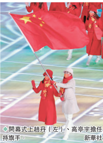
◆開幕式上趙丹(左)、高亭宇擔任持旗手。