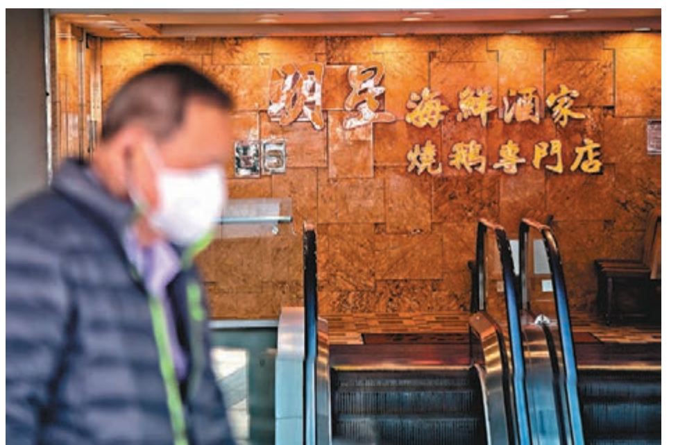
◆在全港擁有14家分店的明星海鮮酒家集團表示，由於近日疫情嚴峻，為保障員工及顧客安全，即日起12間分店暫停營業，有待疫情穩定再作安排。圖為黃大仙明星海鮮酒家。

他們希望稍後在疫情紓緩及實施「疫苗通行證」的前提下，逐步放寬社交距離措施，包括恢復晚市堂食，及放寬食肆座位數目及營業時間，讓餐飲業回復正常營運。