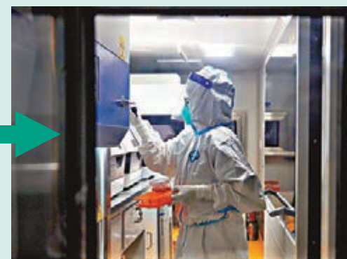
珠海市人民醫院醫療集團檢驗科新冠核酸檢測隊員每天按3班制，每班次2人，24小時檢測，接到樣本後立即開展快速核酸檢測