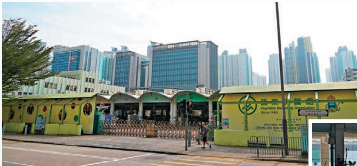
▲長沙灣蔬菜批發市場爆疫，過去10日有逾20人陸續確診，包括菜販及工人。