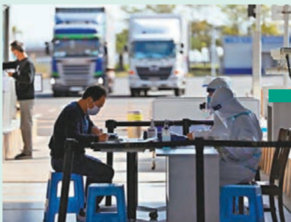
採樣人員在港珠澳大橋珠海口岸貨車圍內對通關的粵港跨境司機進行現場採樣