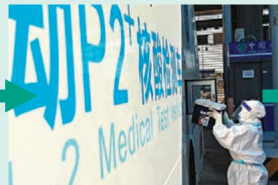
採樣後立即由專員使用生物安全運輸箱，將樣本規範轉運到停放在口岸貨車圍外、約100米遠的「移動P2+核酸檢測車」傳遞窗交接