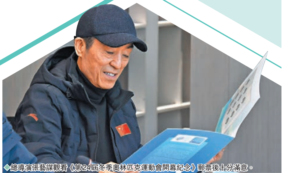
◆總導演張藝謀觀看《第 24 屆冬季奧林匹克運動會開幕紀念》郵票後十分滿意。

另一邊廂，飾演「小三」的劉悅外形火辣性感，現年 24 歲的她畢業於香港專業教育學院，投身模特兒界，前年開始涉足影視界。據知劉悅在《家》劇發揮相當大，除了飾演小三外，也會飾演另一個影響故事劇情的角色，令人期待。