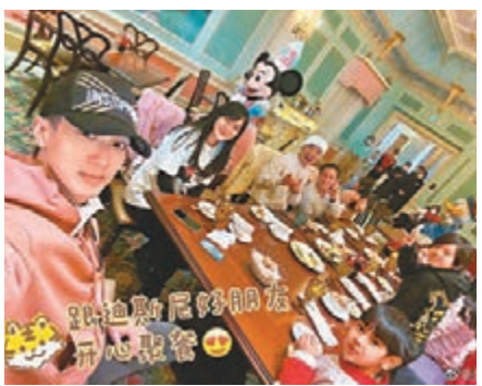
◆吳尊疫情下仍抱正能量生活。