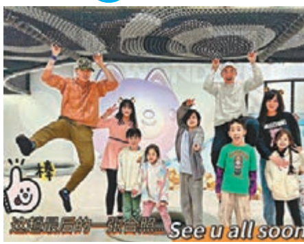
◆吳尊與家人親友度假玩得很開心。