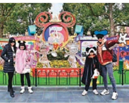
◆吳尊與妻女去迪士尼度假。