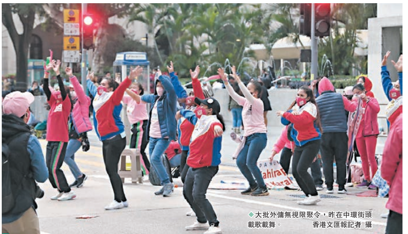
◆大批外傭無視限聚令,昨在中環街頭載歌載舞。

立法會選委界議員江玉歡亦在其Facebook上發帖指出,昨日到中環一帶仍見到一群外傭聚集,部分缺乏風險意識,並無佩戴口罩,有些更放聲高歌,新的限聚規例起不了作用,「在大會堂外的檢測長龍與一個個的外傭帳幕並列一起,甚為諷刺。」她希望特區政府緊急呼籲外傭留家,僱主亦應鼓勵外傭放假留在家中,讓她們休息。