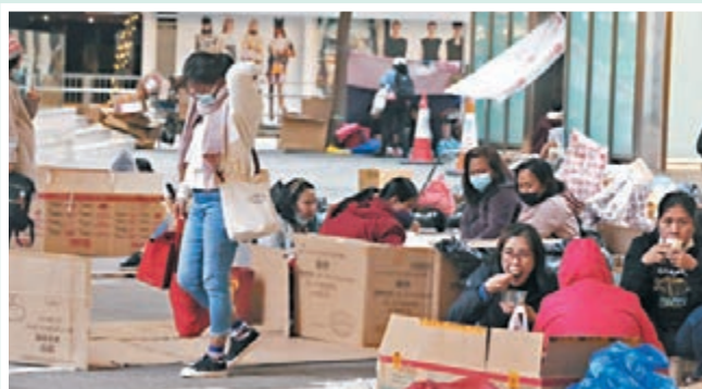
◆有外傭昨在中環街頭聚集用膳,且普遍多於二人以上圍坐,無視二人限聚令。