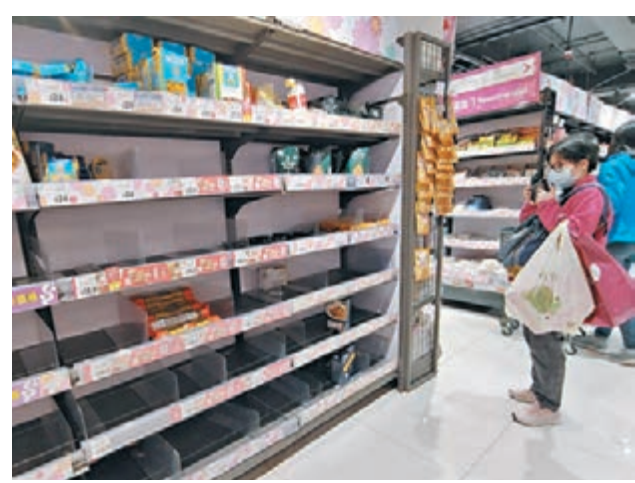
◆一些市民昨日到超市搶購糧食。

地就疫情發展開會後,內地方面已表明會保障內地蔬菜及鮮活食品運輸,市民無須擔心供應問題,呼籲市民理性消費。