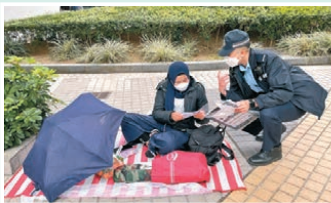
◆警方昨在將軍澳單車館公園向外傭派發宣傳單張,呼籲遵守防疫規例。