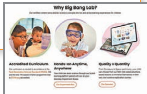
▲ Big Bang Lab推出一系列自家動畫互動內容。

此外，App中也有「一起種」的功能，可與三五好友、同學一起種樹，透過同儕的壓力來互相督促同伴不要分心，否則小樹苗會因此枯萎而不能長成大樹，一次上線最多為500人一起種樹。