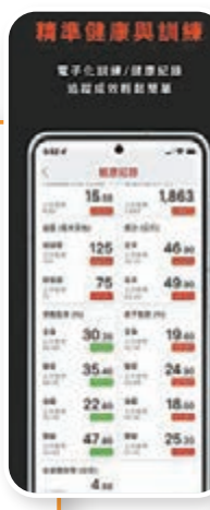
◆ Trainge 具備記錄功能，讓用戶更精準追蹤運動成效。

所有課程和計劃均由擁有10年以上授課經驗的專業認證瑜伽導師親自設計打造，涵蓋阿斯湯加、哈他、流瑜伽、陰瑜伽等傳統瑜伽流派，並巧妙結合普拉提，體現最佳健身功效。Daily Yoga亦有聚集全球瑜伽愛好者的社區，讓用戶隨時分享其練習成果和心得體會，關注他人或被他人關注，以及查看附近的瑜伽愛好者。課程時長亦很靈活，分別有5、10、15、20、30與45分鐘，全程有語音指導，令用戶在家都可恍似在瑜伽中心上堂般。