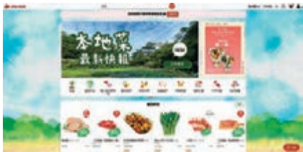
◆ 早晨 Jou Sun 主打本地及有機菜。

變種病毒Omicron的傳染力驚人，身處同一間餐廳堂食都有機會「中招」，不少人都盡量避免在外進食，加上在晚市禁堂食措施下，唯有被迫在家訓練廚藝。奈何不是人人都懂得下廚，市面上有很多可以協助及教導煮食的App可供參考。例如號稱是全球最大的烹飪網站的「Cookpad」，除了提供上萬種的美食做法外，還有新手必備的簡單食譜，內建聊天功能，隨時可向廚友提問煮食相關問題。