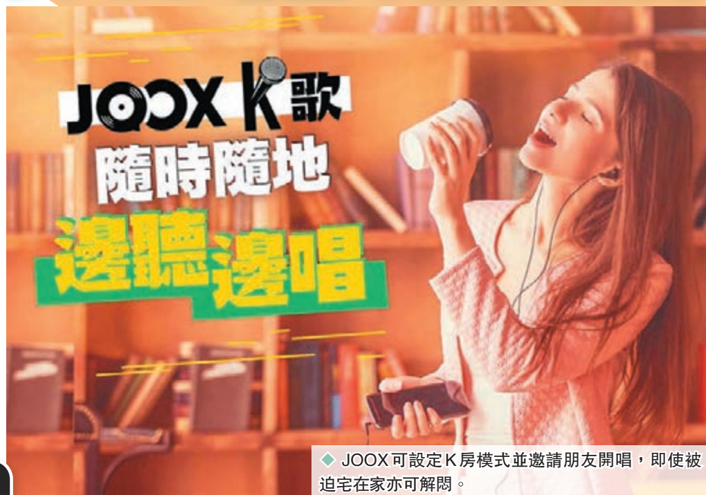
◆ JOOX可設定K房模式並邀請朋友開唱，即使被迫宅在家亦可解悶。

另外，雖然疫情令大家都不能到處旅遊觀光，但 Google 推出的服務「Google Arts & Culture」，則透過360度環景攝影，捕捉世界各大博物館的內部實景，以超高分辨率拍攝各館珍藏的歷史名畫，包括羅浮宮、大英博物館、紐約大都會博物館、台灣美術館、台灣故宮博物院，讓用戶安坐家中也可親歷其景。