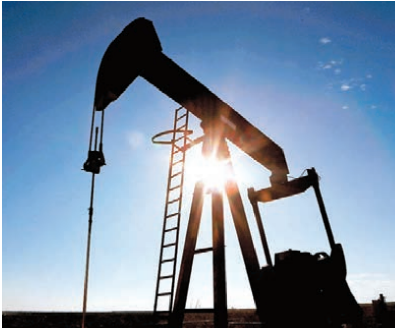
●受惠國際油價持續走高，紐約期油早前一度突破每桶90美元，創逾7年高位。

美元，已大幅高於頁岩油的生產成本，並鼓勵產油商加速新增鑽油井數量。EIA預期，美國原油產量將高於預期，並將今年美國原油日產量預測上調至1,197萬桶；明年原油日產量的最新預測則升至1,260萬桶，較原先預測高約20萬桶，屆時，美國原油日產能將創歷史新高。此外，EIA預計，隨OPEC+的產量在今年中開始明顯回升，原油將面臨調整壓力。