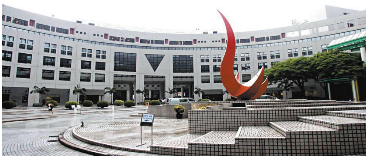
教資會最新公布本港各大學的《知識轉移年報》顯示，科大的知識轉移總收入由2019/20年度約10.4億元，增至2020/21年度的15億元，升幅達44.2%。圖為科大校園。