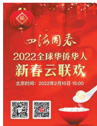
◆今日下午3時，中國僑網、中國新聞網將聯合百家華文媒體，面向全球播出「雲聯歡」。

本屆「雲聯歡」由國務院僑務辦公室、中華全國歸國華僑聯合會、中華海外聯誼會主辦，中國僑網承辦，冀在元宵佳節之際為海內外同胞送上新春的祝福和暖意。