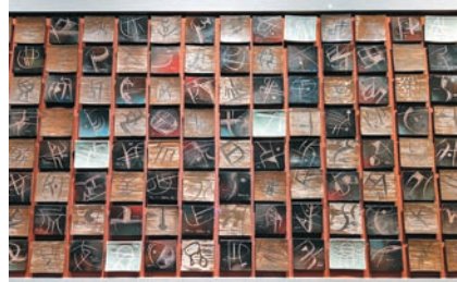
◆韓美林作品《天書刻盤》以甲骨文為主題