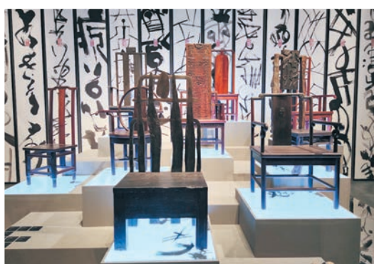
◆韓美林作品《天書木雕椅》