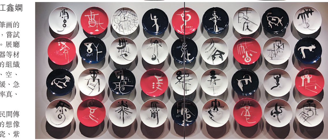
◆韓美林作品《天書刻盤》

「納天為書——韓美林天書藝術故宮展」早前在故宮博物院午門展廳開幕，展覽以著名藝術家韓美林的「天書」藝術為元素，拓展至水墨、陶瓷、紫砂、印染、木雕、鐵藝等各個領域，1,500件作品分為「千里路，萬卷書」「觀其全，知其通」「取其宜，鑄今風」「遊於藝，競自由」「界未界，任西東」5個單元，豐富多樣地呈現出韓美林「天書」藝術。今次展覽是繼2019年「韓美林生肖藝術大展」之後，韓美林藝術第二次進故宮展覽。亦是85歲高齡的韓美林首次將他的「天書」系列作品全面、大量、獨立地展出。據悉，展覽將持續至2022年3月20日。