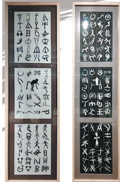
◆「天書」取材於甲骨、石刻、岩畫、古陶、青銅、磚銘、石鼓等歷代文物上的數萬個古文字符號。