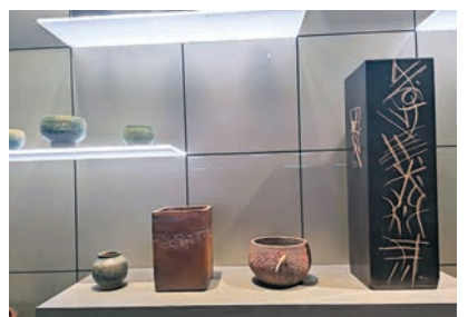
◆韓美林作品《天書陶瓷瓶》