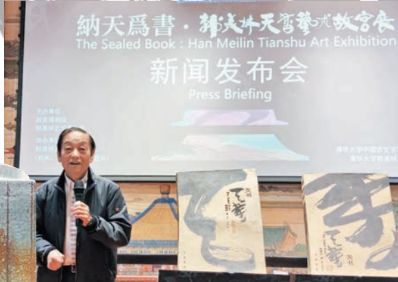
◆韓美林新書同步首發。

「『天書』在我的藝術領域裏，是特殊的存在，對我的藝術和靈感是質的提升和改變。故宮是中華文化的一個最大的家。能夠兩次進故宮辦展覽，是我對民族文化的溫情敬意。」韓美林說。