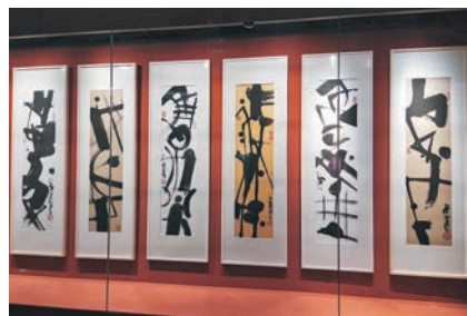
◆「天書」藝術取材於甲骨、岩畫等文物上的古文字符號。