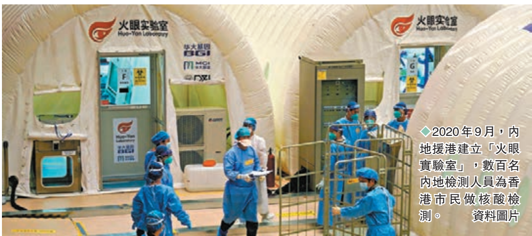
◆2020年9月，內地援港建立「火眼實驗室」，數百名內地檢測人員為香港市民做核酸檢測。 資料圖片