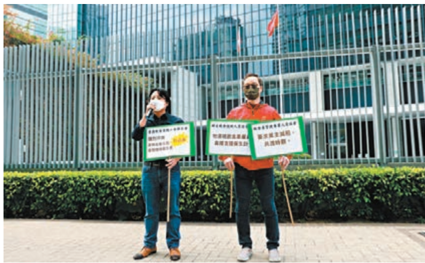
◆香港飲食業職工聯合會會員昨日到政府總部請願，促請政府於第六輪「防疫抗基金」中，直接資助受影響飲食業僱員。

既以過去多項措施為藍本，亦盡可能涵蓋早前未能受惠的行業和個人，目標是最簡單快捷的方式，提供具針對性的支援。她指出，在規劃過程中，特區政府認真參考了立法會議員和業界的意見，盡力做到「補漏拾遺」。