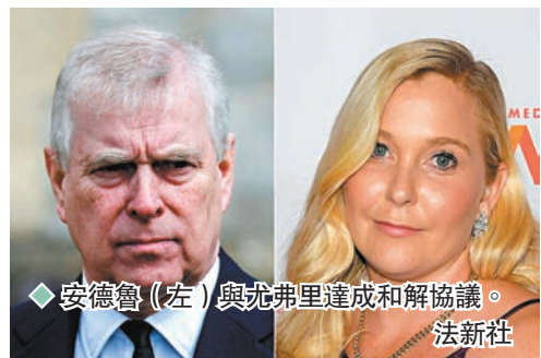
◆安德魯(左)與尤弗里達成和解協議。

英國安德魯王子的性侵案民事訴訟出現新發展，安德魯與案中原告、38歲美國女子尤弗里達成和解協議，安德魯將向對方作出賠償，但未有公開金額。