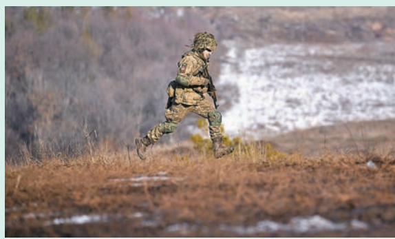
◆烏克蘭士兵進行演練。

拜登稱，俄羅斯在烏克蘭附近及白俄羅斯境內部署15萬大軍，仍可能「入侵」烏克蘭。拜登表示，對俄羅斯「侵烏」做好果斷反應的準備。克里姆林宮發言人佩斯科夫昨日表示，拜登希望繼續就烏克蘭危機進行會談是「正面訊息」，強調談判將非常複雜，需要雙方展示彈性，稱俄方對美國作出的威脅「感到厭倦」。 ◆綜合報道