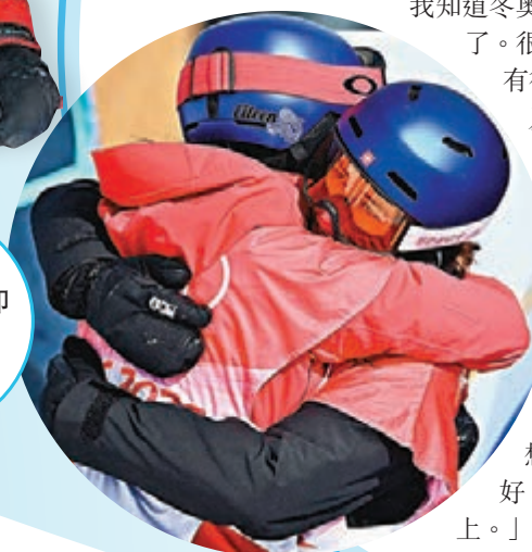
▶谷愛凌(左)的頭盔印有「龍」圖案。

谷愛凌還特意提到了她衣服和頭盔「人中之龍」的概念。「這是我自己設計的,雪板上寫了人中之龍,我特別喜歡。覺得龍讓我特別自信特別有力量——我不想當人,我想要當龍,我想把自己做到最好,這個精神我覺得特別好,所以就把它放在了雪板上、頭盔上。」