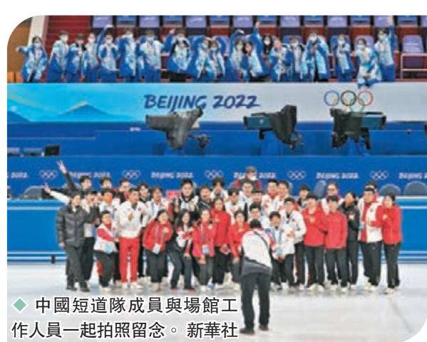
◆中國短道隊成員與場館工作人員一起拍照留念。