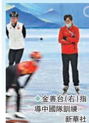
◆金善台(右)指導中國隊訓練。

香港文匯報訊(記者 楊浩然)協助中國短道速滑隊在今屆冬奧斬獲2金1銀1銅的韓國教頭金善台，近日宣布返回韓國，暫時未知會否再次歸來繼續帶領中國速滑隊。