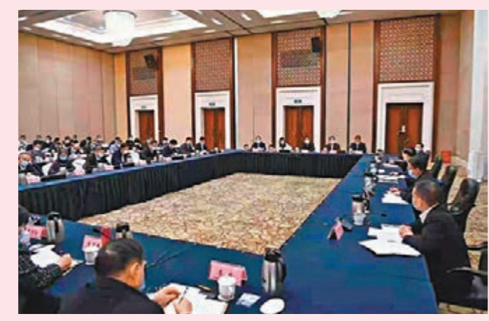
夏寶龍在深圳主持召開支援香港防疫工作第三次協調會。

香港文匯報訊 2月19日，全國政協副主席、國務院港澳辦主任夏寶龍在深圳主持召開支援香港防疫工作第三次協調會。各工作組報告了支援香港防疫工作進展情況。第二批援港抗疫醫療防疫工作隊114人入港，內地援建社區隔離治療設施開工，首批N95口罩、快速抗原檢測包等醫療物資到港，供港鮮活食品水路通道開通。