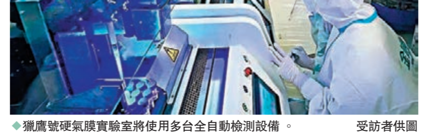
獵鷹號硬氣膜實驗室將使用多台全自動檢測設備。

內地專家團昨日上午到訪位於新蒲崗的個案追蹤辦公室，了解特區政府就確診個案進行的流行病學調查及接觸者追蹤工作，亦分享了內地在個案追蹤方面的經驗。