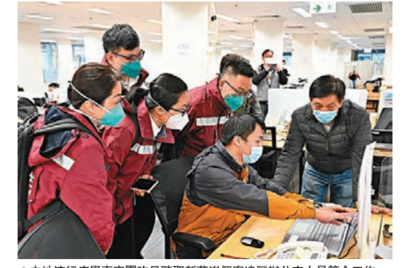
內地流行病學專家團昨日聯取新蒲崗個案追蹤辦公室人員簡介工作。