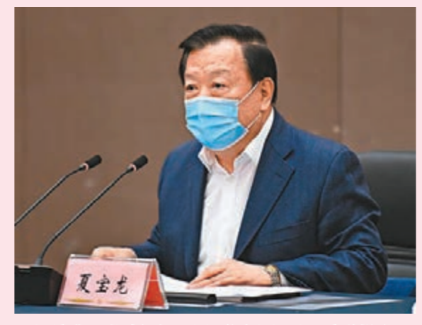
夏寶龍要求確保每一項工作部署迅速、高效推進。

香港文匯報訊 2月19日，全國政協副主席、國務院港澳辦主任夏寶龍在深圳主持召開支援香港防疫工作第三次協調會。各工作組報告了支援香港防疫工作進展情況。第二批援港抗疫醫療防疫工作隊114人入港，內地援建社區隔離治療設施開工，首批N95口罩、快速抗原檢測包等醫療物資到港，供港鮮活食品水路通道開通。