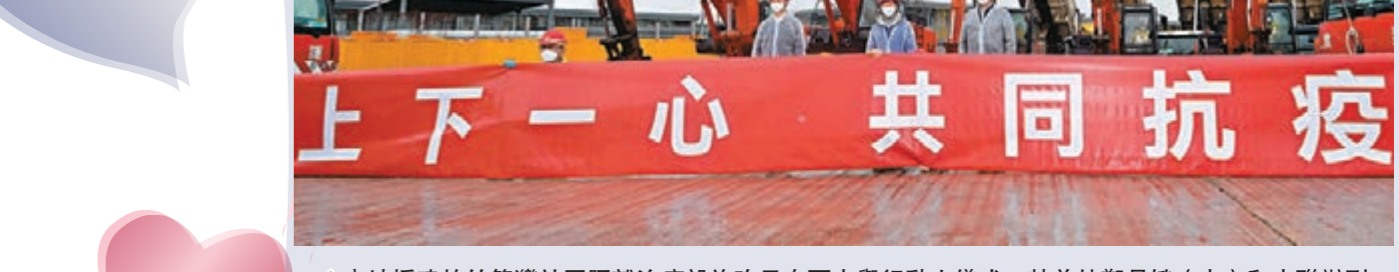
內地援建的竹篙灣社區隔離治療設施昨日在雨中舉行動土儀式，特首林鄭月娥(中)和中聯辦副主任尹宗華(右)出席。

特區現時的短板之一就是社區隔離和治療設施，故衷心感謝中央接受其請求，讓特區能委託內地施工團隊在最短的時間內建立社區隔離和治療單位。