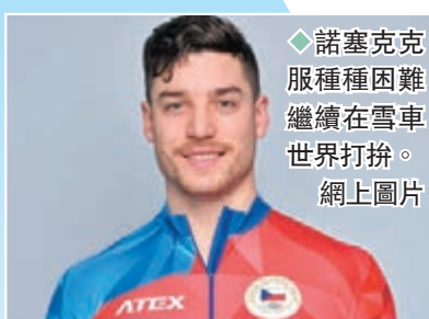
諾塞克克服種種困難繼續在雪車世界打拚。

「剛開始的時候和他一起配合真的很難，因為在比賽的時候幾乎無法溝通。從推車啟動到跳進雪