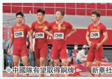
中國隊有望取得銅牌。

烏賈此後並未對其違反反興奮劑條例提出質疑，但辯稱自己並非故意使用興奮劑，並認為違禁物質來源可能是攝入了受污染的營養品。國際體育仲裁法庭最終認定烏賈違反了《國際奧委會反興奮劑條例》，裁定取消其