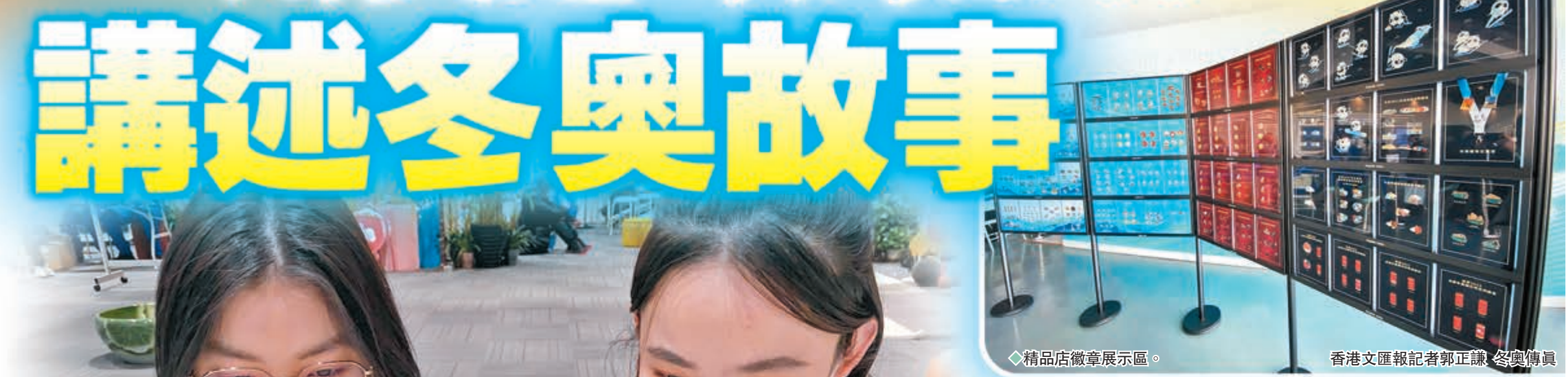
精品店徽章展示區。