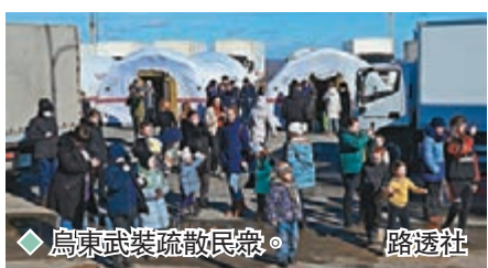
◆烏東武裝疏散民眾。

俄國防部表示，這次演習目的是檢視各軍事指揮部門、戰鬥編隊、艦船機組及導彈運載裝置的備戰情況，檢驗俄羅斯戰略核武器以及非核武器的可靠性。克里姆林宮發言人佩斯科夫在演習前表示，這樣的演習自然不能在國家元首缺席情況下舉行，更暗示用於下達發射核武器指令的核手提箱，同樣處於克里姆林宮戰情室內。