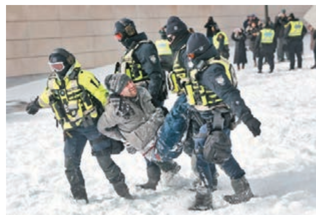
◆加拿大警方拘捕多名示威者。

警方在現場反覆發出警告，要求示威者必須離場，在執法區域內的任何人都可能被捕，同時提醒在場媒體保持距離並遠離警方行動，以策安全。警員其後排成人牆緩慢推進，逼退示威者，前排警員佩戴防暴頭盔。其間有示威者攻擊警員，並試圖搶奪警員的