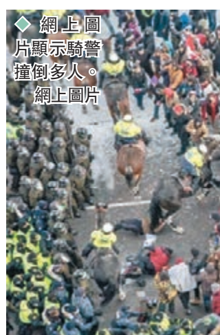
◆網上圖片顯示騎警撞倒多人。網上圖片