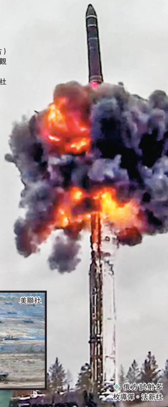
◆俄方試射多枚導彈。