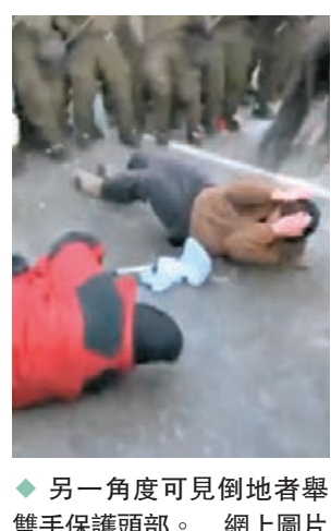
◆另一角度可見倒地者舉雙手保護頭部。