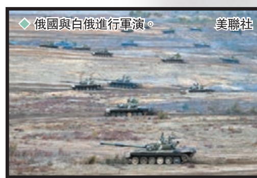
◆俄國與白俄進行軍演。