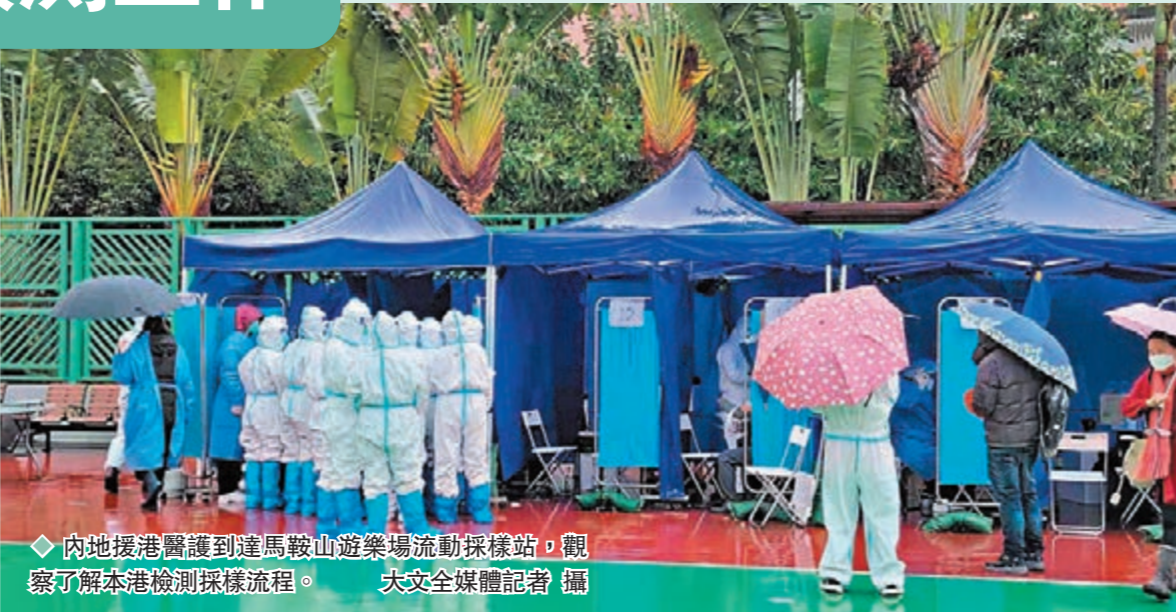
◆內地援港醫護到達馬鞍山遊樂場流動採樣站，觀察了解本港檢測採樣流程。大交全媒體記者攝