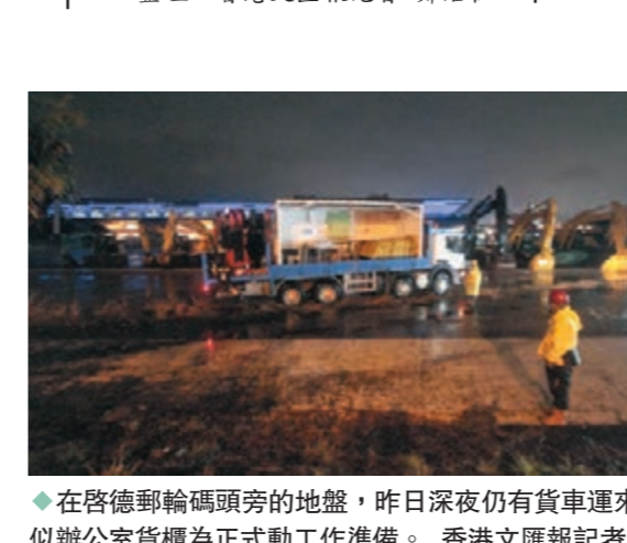
◆在啟德郵輪碼頭旁的地盤，昨夜日仍有貨車運來疑似辦公室貨櫃為正式動工作準備。