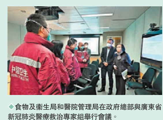
◆食物及衛生局和醫院管理局在政府總部與廣東省新冠肺炎醫療救治專家組舉行會議。

協助香港應對第五波疫情的訪港內地流行病學專家團昨日繼續考察行程，包括了解特區政府在檢疫隔離方面工作等。日前抵港的內地流行病學專家小組成員包括來自廣東省、廣州市及中山市的疫情防控專家。