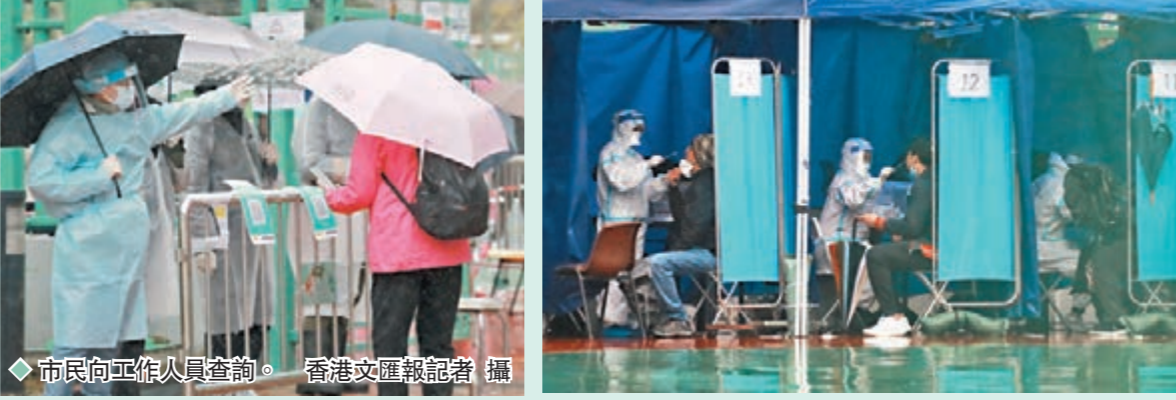
◆市民向工作人員查詢。