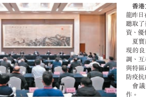
◆夏寶龍昨日在深圳主持召開支援香港抗疫工作第四次協調會。

香港文匯報訊 全國政協副主席、國務院港澳辦主任夏寶龍昨日在深圳主持召開支援香港抗疫工作第四次協調會。會議聽取了援港抗疫情醫療防疫工作隊在港工作、調集援港醫療物資、優化供港生活物資跨境運輸等情況的匯報。夏寶龍對於工作專班成立短短幾天所取得的工作成效和展現的良好作風給予充分肯定，強調各工作組要加強溝通協調、互相配合、互相補位，穩妥、高效地推進各項工作；要與特區政府密切協調、精準對接，全力支持特區政府履行好防疫抗疫主體責任，確保各項議定事項落實到位。會議還研究了協助特區政府加快建設方艙醫院等有關工作。