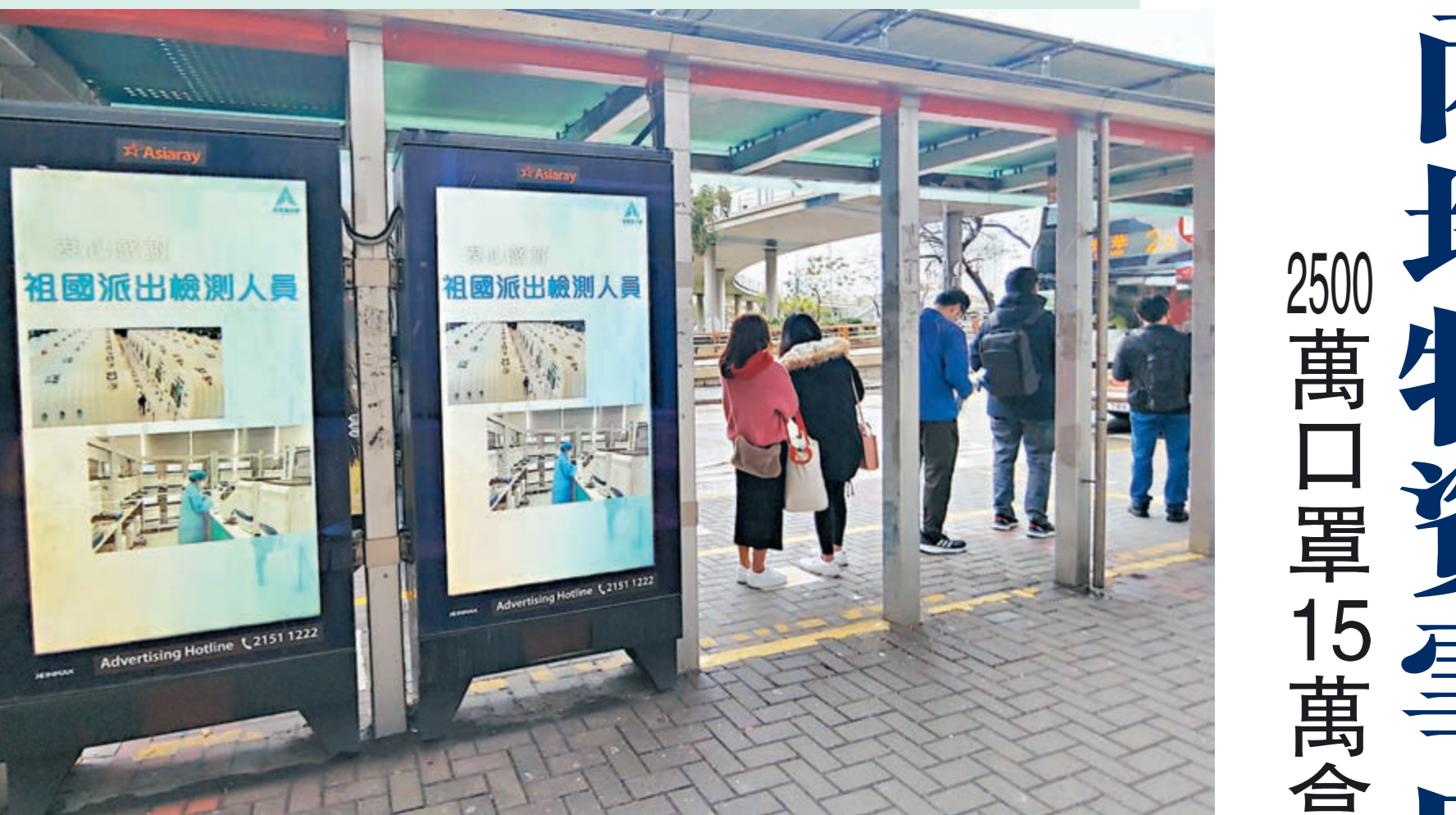
◆內地支援隊到港後，昨日有巴士站展示感謝廣告。