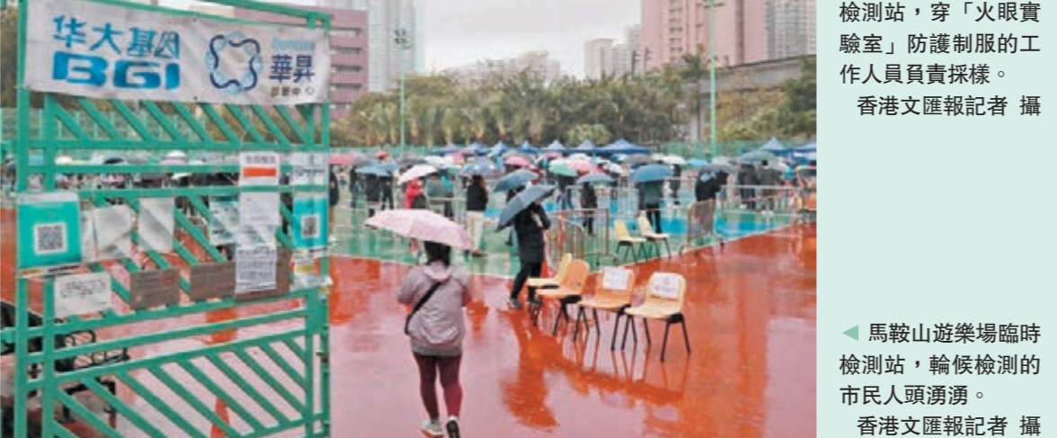
▲馬鞍山遊樂場臨時檢測站，穿「火眼實驗室」防護服的工作人員負責採樣。