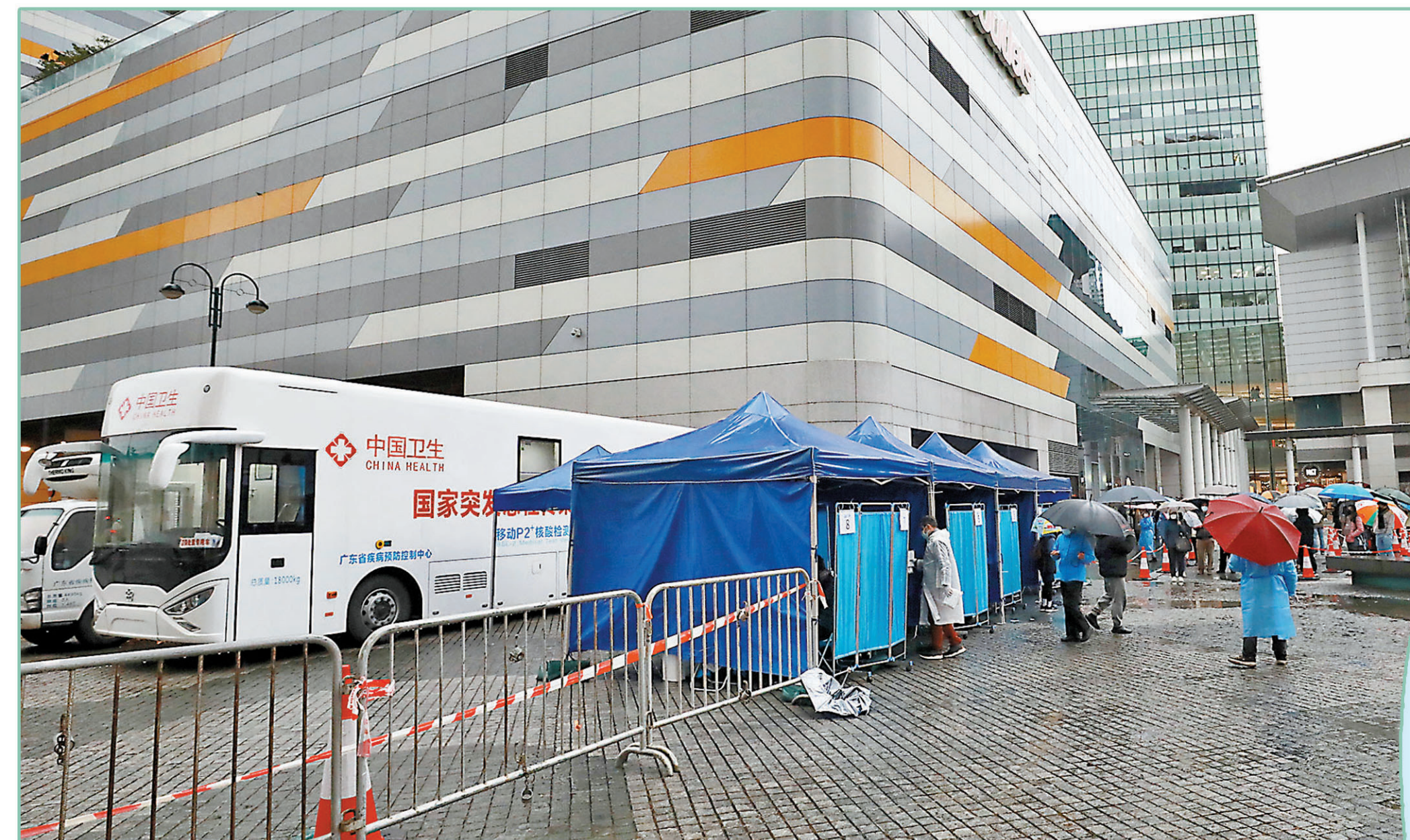
東涌東薈城露天廣場採樣站昨天連運作，內地援港P2+核酸檢測車到場支援檢測，至24日結束。

由內地支援香港防疫工作專車運抵的第二批內地援港防疫醫療隊工作隊日前抵港，他們當中的110人核酸採樣隊將配合特區政府開展核酸檢測等方面的工作。