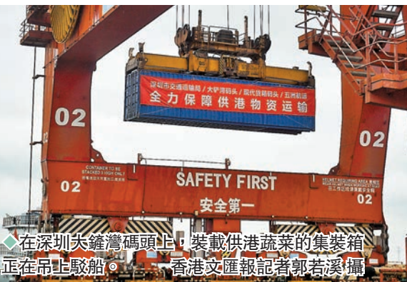
在深關大鵬灣碼頭上，裝載供港蔬菜的集裝箱正在吊上駁船。

香港文匯報訊（記者 郭若溪 深圳報導）昨日傍晚，滿載200噸供港蔬菜的駁船從深圳大鵬灣碼頭駛來香港，於當晚到達香港現代貨碼頭。深圳大鵬灣、媽灣和鹽田東裝箱區各自開通供港物資水路運輸快速通道，3條定時定點駁船專用航線，將保障港人生活物資供應。 昨日下午，香港文匯報記者在深圳大鵬灣碼頭看到，工作人員正在積極準備供港蔬菜、生活日用品的集裝箱裝船作業。大鵬灣碼頭組織的這批運輸物資為供港蔬菜、水果、雞蛋等，共計26個標箱，約200噸。 當晚10時，在媽灣碼頭，港口駁船滿載共計52個標箱生活物資始發，約315噸，午夜到達香港屯門內河碼頭。這批物資還包括香港居民網上採購的毛巾、睡褲、牙刷、拖鞋等生活日用品。 此外，昨晨5時，鹽田國際碼頭有4個標箱供港蔬菜運往香港，共計約51噸，已於當日到達香港碼頭並經香港食安中心查驗後立即投放市場。