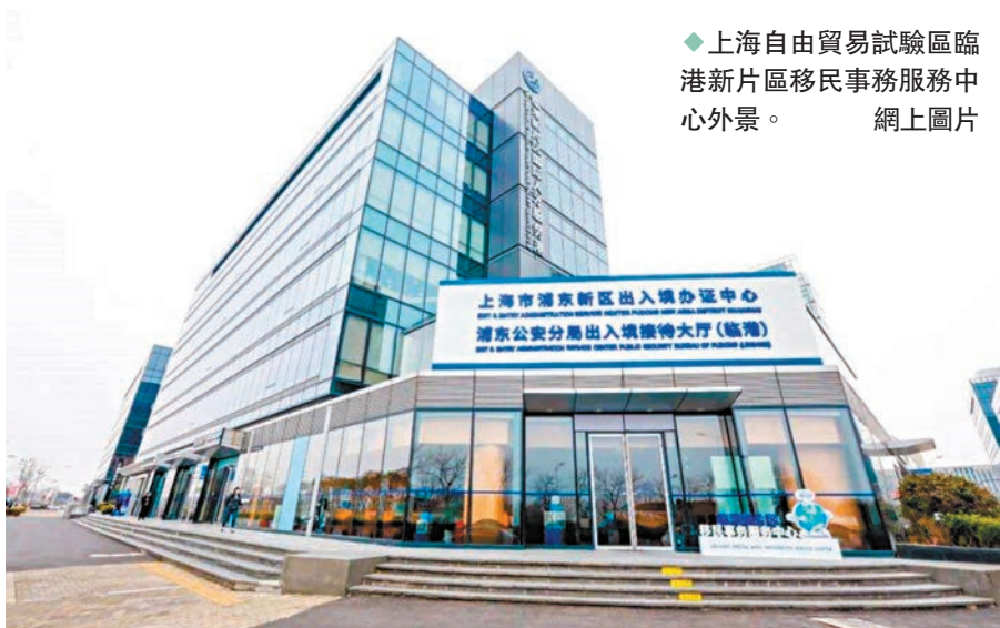
◆上海自由貿易試驗區臨港新片區移民事務服務中心外景。