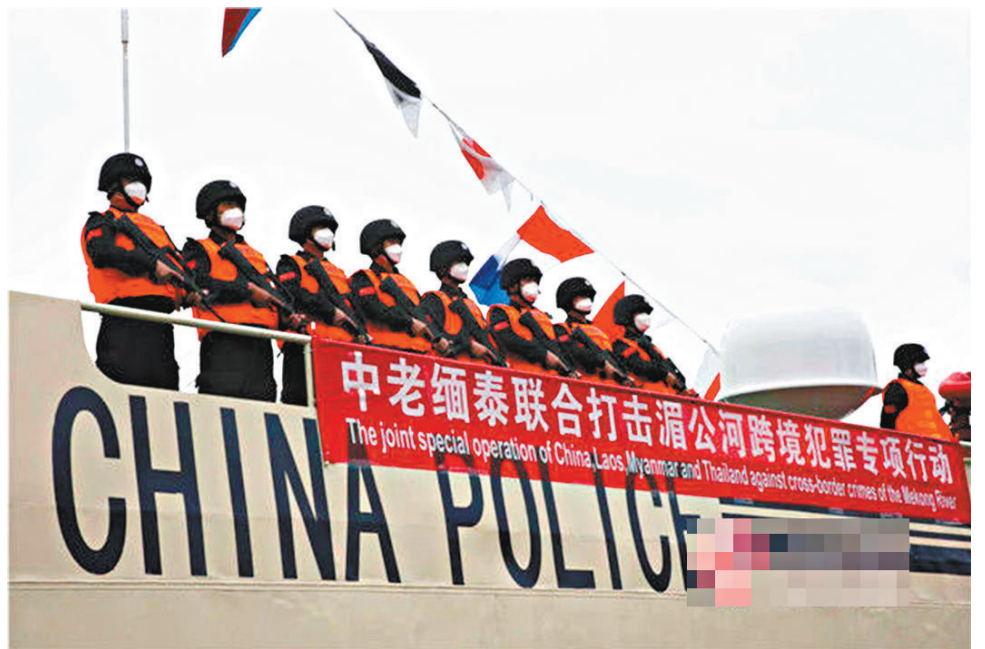
◆中國執法艇從雲南省西雙版納傣族自治州景哈碼頭鳴笛啟航。

此次行動，中老緬泰將派出執法船艇5艘，開展全線和重點水域聯合巡邏執法，預計用時4天3夜，總航程600餘公里。參與行動的執法艇和執法隊員將嚴格落實各項疫情防控措施，採取「非接觸」方式開展聯合