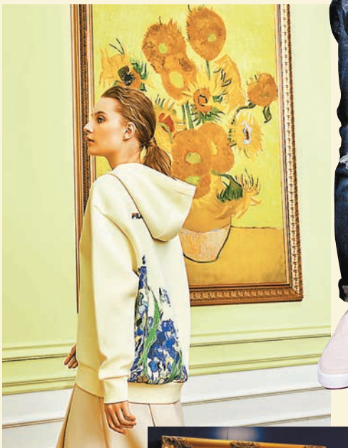
◆採用《Vase with Gladioli and Chinese Asters》元素的單品，以互補色設計突顯畫作的強烈色彩對比。

今次聯乘系列把梵高對藝術創作的熱情，和畫作當中豐富的色調，由服裝演繹出來，猶如把博物館搬到身上，讓大家以不一樣的角度感受梵高舉世聞名的畫作。系列設有男女裝款式，以白色、淺黃色、黑色為主調，並融入梵高畫作的標誌性顏色，如熱情的黃色、青翠的綠色、深邃的靛藍色、恬靜的灰藍色等，服裝亦保留了品牌一貫時尚運動風格，採用寬鬆版型，同時為了讓服裝上的畫作栩栩如生，系列更以立體油畫圖案配以精緻刺繡工藝，或將仿油畫的筆觸感印在服裝上，加上梵高簽名「Vincent」的刺繡，設計師在細節上盡顯心思，奢華精美。