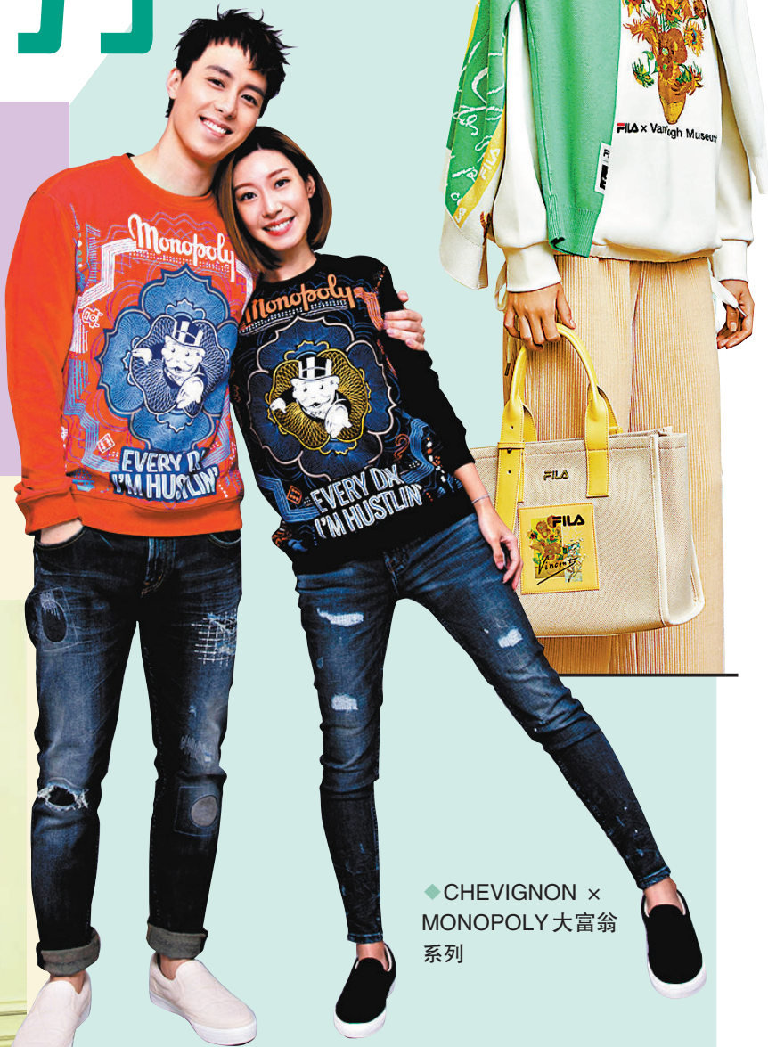
◆CHEVIGNON x MONOPOLY大富翁系列