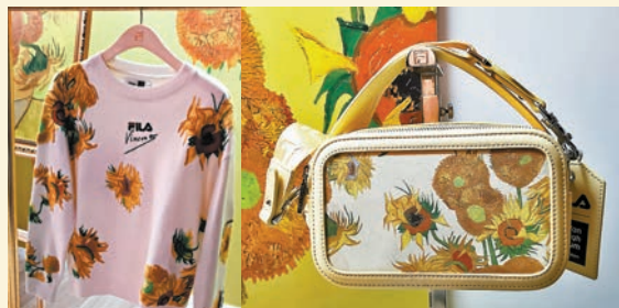
◆以《Sunflowers》為靈感，藉刺繡繡出向日葵或在向日葵圖案上加上刺繡工藝，將畫作中的向日葵以不同角度展示。