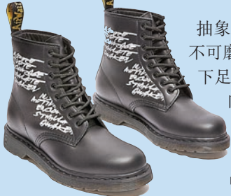
◆1460 EMB FUTURA靴子

抽象塗鴉先驅FUTURA LABORATORIES在藝術界留下了不可磨滅的印記，現在他在DR. MARTENS知名的靴子上留下足跡，在品牌標誌性的1460靴子綴上兩個創新的元素——向由龐克定義的創作生涯致敬，並保留DM精神。在這個由兩部分組成的合作中，由黑色Nappa皮革製成，1460 EMB FUTURA靴子繡有FUTURA手寫藝術品，黑色鞋孔和貼邊縫線與FUTURA大膽的白色刺繡形成鮮明對比，同時還採用了黑黃色鞋跟環和雙品牌鞋墊，並配上煙灰色鞋底。