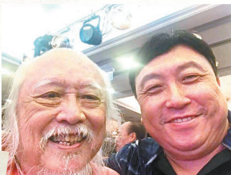
◆王晶相信「契師父」絕對無憾。

香港文匯報訊（記者 阿祖）香港著名導演楚原（原名：張寶堅）於前日（21日）病逝，享年88歲。楚原兒子張詩樂昨日向傳媒發悼文，並引用向瀉的宋詞悼念父親，他表示會遵照先父遺願一切從簡，喪禮由家人閉門憑弔。楚原為人處事深受後輩敬重，一眾藝人及導演獲悉楚原離世亦深表不捨，難忘他的幽默感及關愛後輩之心，並讚頌他對演藝影視界貢獻良多。