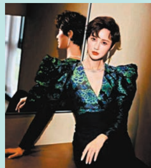
◆張歆藝相信主演話劇是對演員身份的一種證明。

香港文匯報訊（記者 胡若璋 廣州報道）作為廣州大劇院2022女性藝術節開幕大戲的《我不是潘金蓮》將於3月4、5號在穗開啟全國巡演的首演。該劇由丁一滕執導，也是張歆藝的公開售票的話劇舞台首秀。