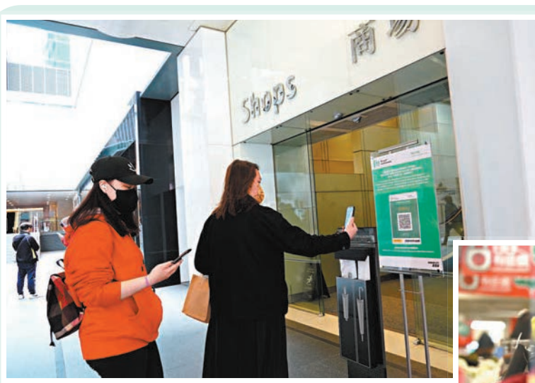
疫苗通行證於昨日起實施，市民進入商場使用「安心出行」流動應用程式掃碼才可進入。

領展表示，旗下75個商場和52個鮮活街市已為全面實施疫苗通行證作好準備，會在客流量較大的商場和街市主要出入口增派人手，協助市民掃描「安心出行」二維碼，以遵守有關新規定。