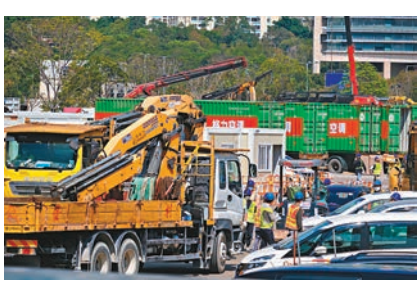
◆建造業議會決定在下月14日起全港工地實施「疫苗證」。

望業界跟隨推行「疫苗通行證」，又強調面對嚴峻疫情，減低人群聚集至關重要，希望業界審視員工及營運的安排，盡量壓縮在辦公室上班的人數，減低病毒傳播風險，市民應盡量使用網上理財渠道，減少到訪實體分行，又呼籲金融業界落實好防疫措施。