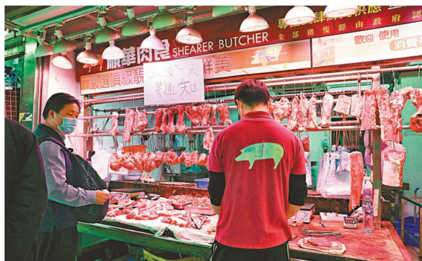
▶連日來的鮮肉供應十分緊張，鮮豬肉價格猛漲至每斤逾60元，牛肉價格更翻倍至280元。